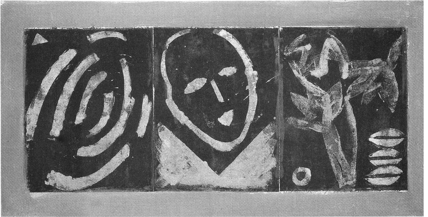
Paolo Pola, «Sequenza 1992», tecnica mista, 45x83 cm

gia) divide i due campi del quadro. Il dipinto Grande Tavola di segni (92/42) illustra uno dei principi compositivi di Pola: sullo sfondo differenziato da varie tinte appaiono i segni dai significati più diversi su strati cangianti del quadro, rispettivamente dello spazio; con mezzi puramente pittorici Pola ottiene così un effetto altrimenti riservato esclusivamente alla tecnica del collage.