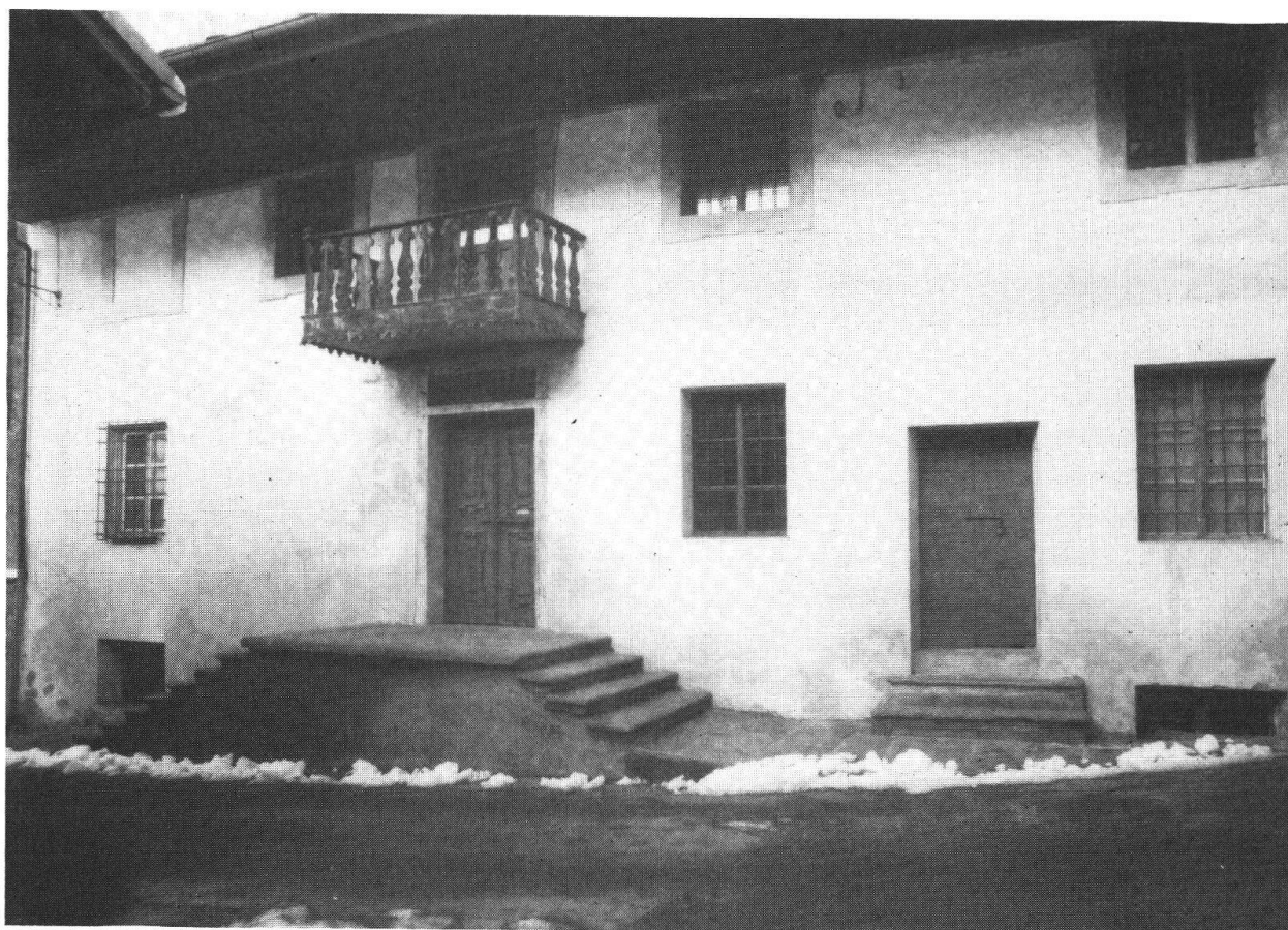
La «nuova casa Riva» o «Ospizio Riva» nella Degagna di Campagna, ora Frazione di San Giulio, a Roveredo, sede della prima scuola popolare roveredana (1718-1846)