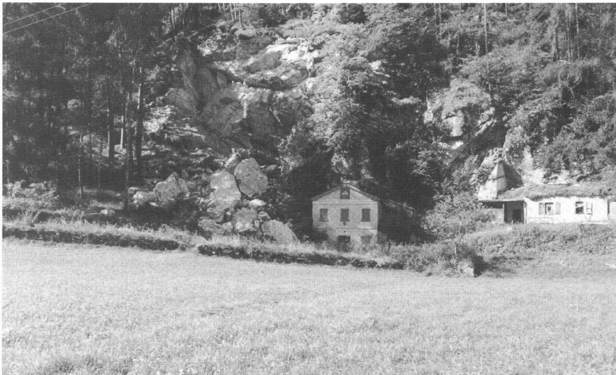
Il Crotto con l'«emblemata della Pace, in campo rosso, la bianca croce tua repubblicana» e a sinistra, la roccia franata e il boschetto dei larici piantati da Pietro Lardi nel 1889

E davanti, sul muro, o Patria, sta emblemata de la Pace, in campo rosso la bianca Croce tua repubblicana. (p. 31)