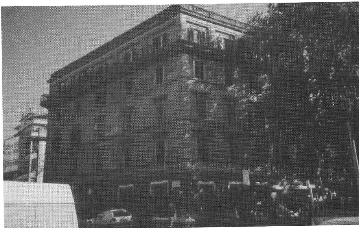
Palazzo Lardi a Piazzale Ponte Milvio, Roma

Pietro nel 1904, ai quali avevano preso parte numerosi nobili della Capitale con uno spiegamento di carrozze con tiri a sette. E tanti libri. E fra i libri qualche decina di copie invendute de «I canti del mio paesello». E nell'ultima camera, per segni evidenti la tua camera da letto,