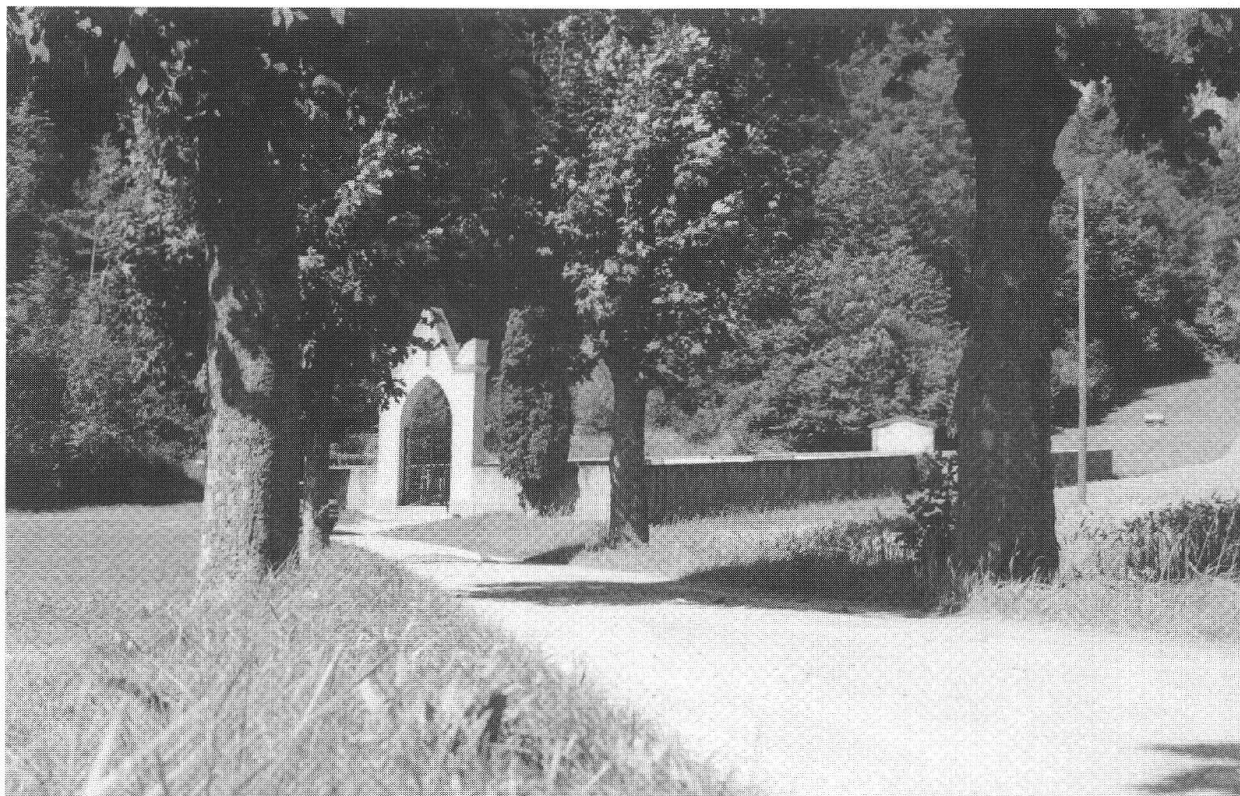
Il camposanto ingrandito grazie al lascito di Valentino Lardi