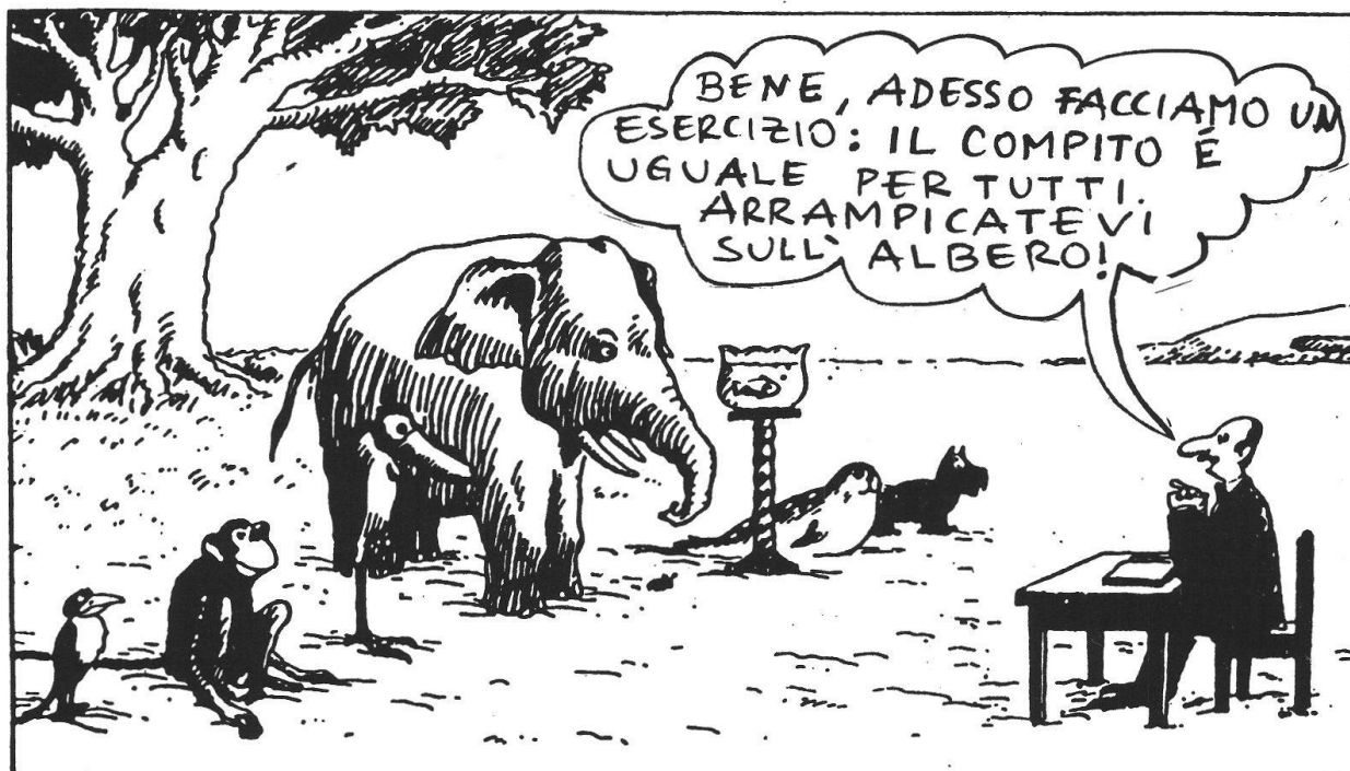
Illustrazione 1 - La finzione dell'omogeneità delle classi

ripercuotono nei risvolti statistici piú recenti (riportati sopra).