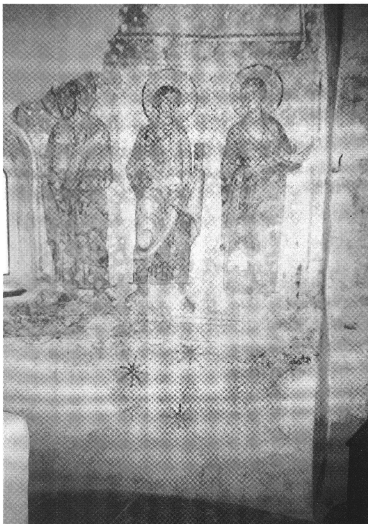
Gli apostoli Giuda-Taddeo, Matteo e S. Paolo affrescati sulla parete dell'abside, rinvenuti nel 1987

Del resto, il carattere primitivo delle pitture è immediatamente percettibile sia per l'impostazione d'insieme della composizione figurativa che tiene poco conto delle simmetrie spaziali sia per la presenza di taluni dettagli che sono sicuri indizi di antichità, come le aureole enormi cerchiare di nero e lumeggiate di giallo, i rotoli (e non i libri) nelle mani degli apostoli, talora porti con la mano avvolta nel manto alla maniera orientale, la presenza delle stelle ad otto punte nello zoccolo e nei vani delle finestre,