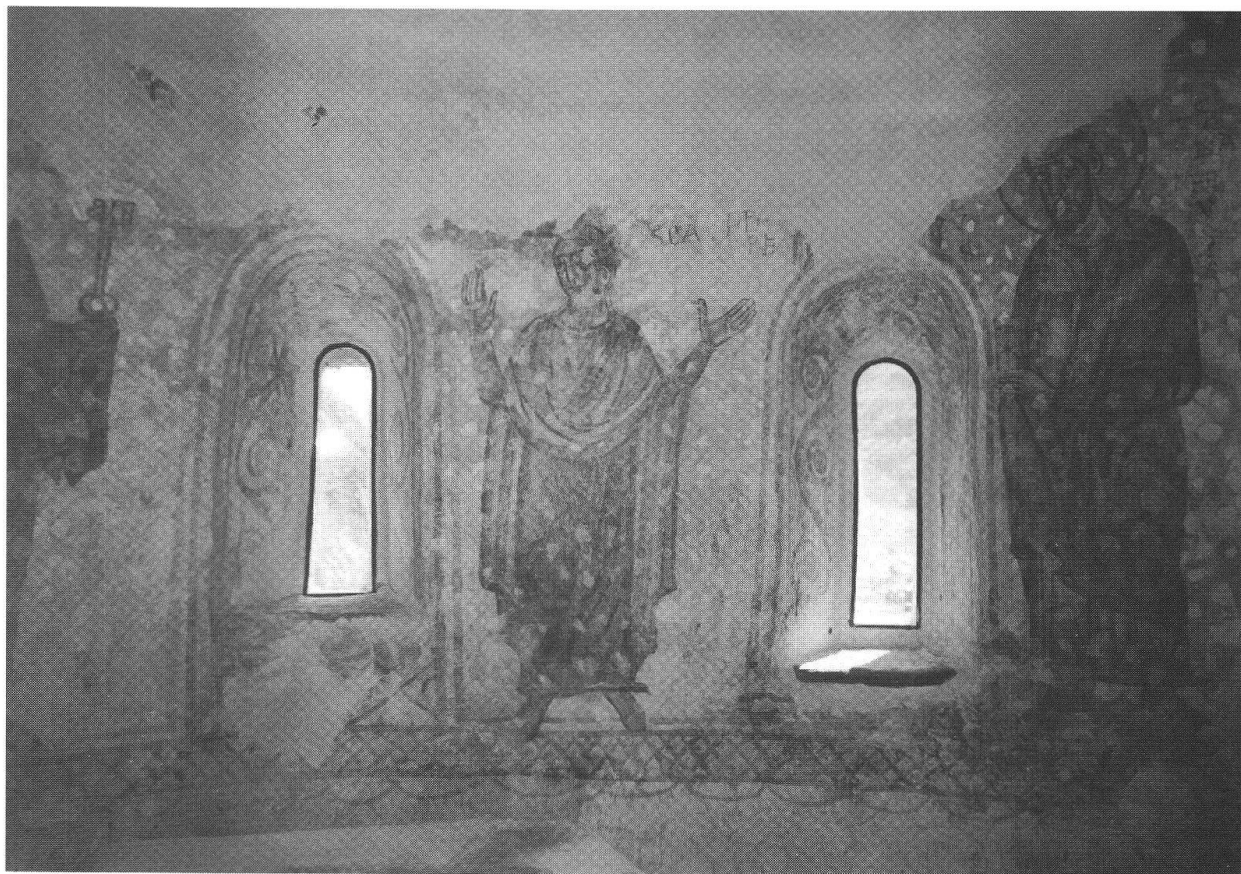
Santa Perpetua Orante, immagine suggestiva venuta alla luce durante i restauri del 1991.

praticato fin dalla protostoria come indicano i reperti archeologici della età antica delle valli retiche e, ancor più eloquenti poiché rinvenuti poco lontano dal colle di Santa Perpetua, quelli di Tirano: i pugnali di Piattamala ritrovati in località Al Crotto a lato della mulattiera non lontano dalla chiesa e dal valico di frontiera, e il fermaglio di cinturone – pure di bronzo – venuto alla luce alla «Giustizia», ai piedi del castello del Dosso che fronteggia la valle di Poschiavo.