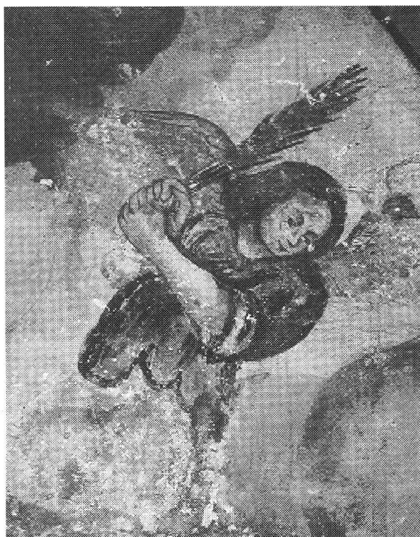
Angelo del giudizio universale, Ossario di Cauco

L'ossario di Cauco merita di essere conosciuto e apprezzato per gli affreschi di Johann Jakob Rieg da Somvico (Sumvitg) che si va scoprendo sempre più come un vero maestro nel suo genere, primitivo per certe carenze tecniche, ma insuperabile nell'impasto dei colori, l'ingenua poesia e