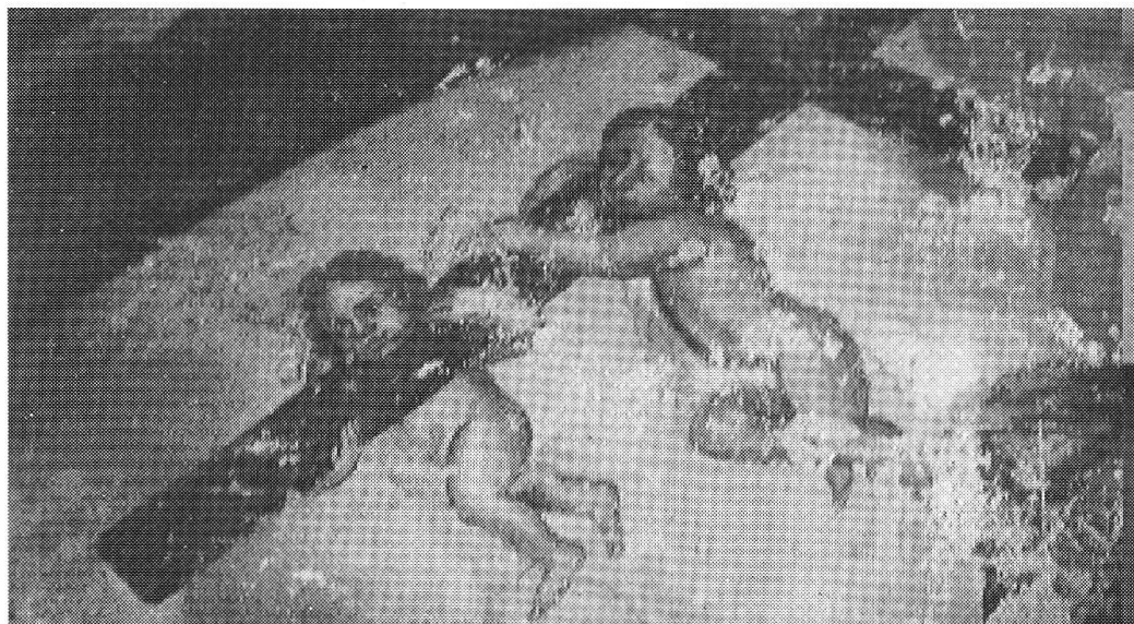
Angeli della parusia di Cristo

l'espressione della fede popolare. Le sue opere, oltre che in Calanca, si incontrano un po' dappertutto nella valle del Reno anteriore, a Truns, Obersaxen, Dardin, ecc., e anche in Val di Blenio e a Isola Madesimo nel Chiavennasco. Considerato nel contesto della rivalutazione delle opere del Rieg attualmente in atto, il restauro dell'ossario di Cauco si rivela un'operazione di altissimo valore culturale.