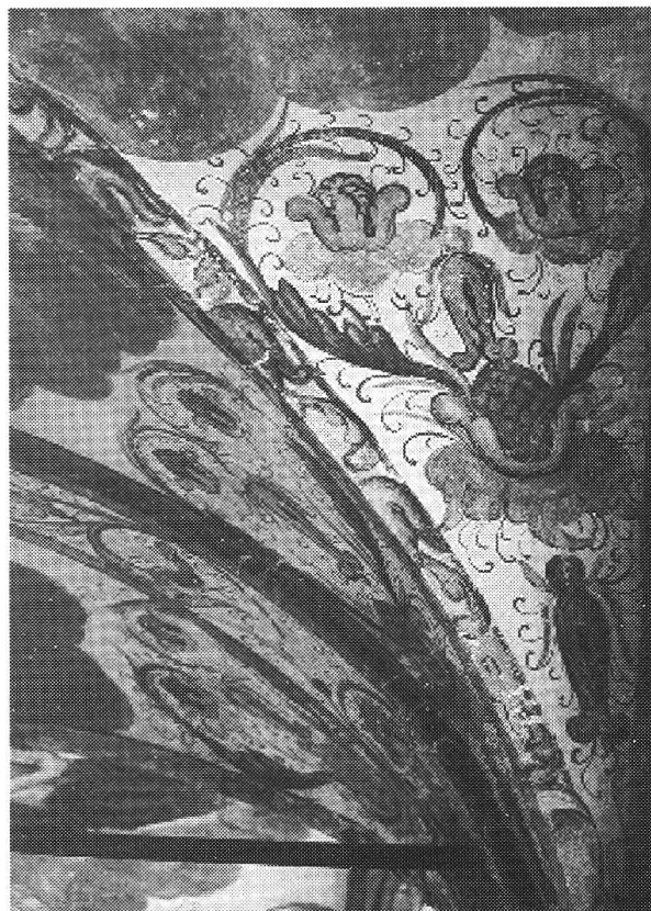
Ornamenti, Ossario di Cauco