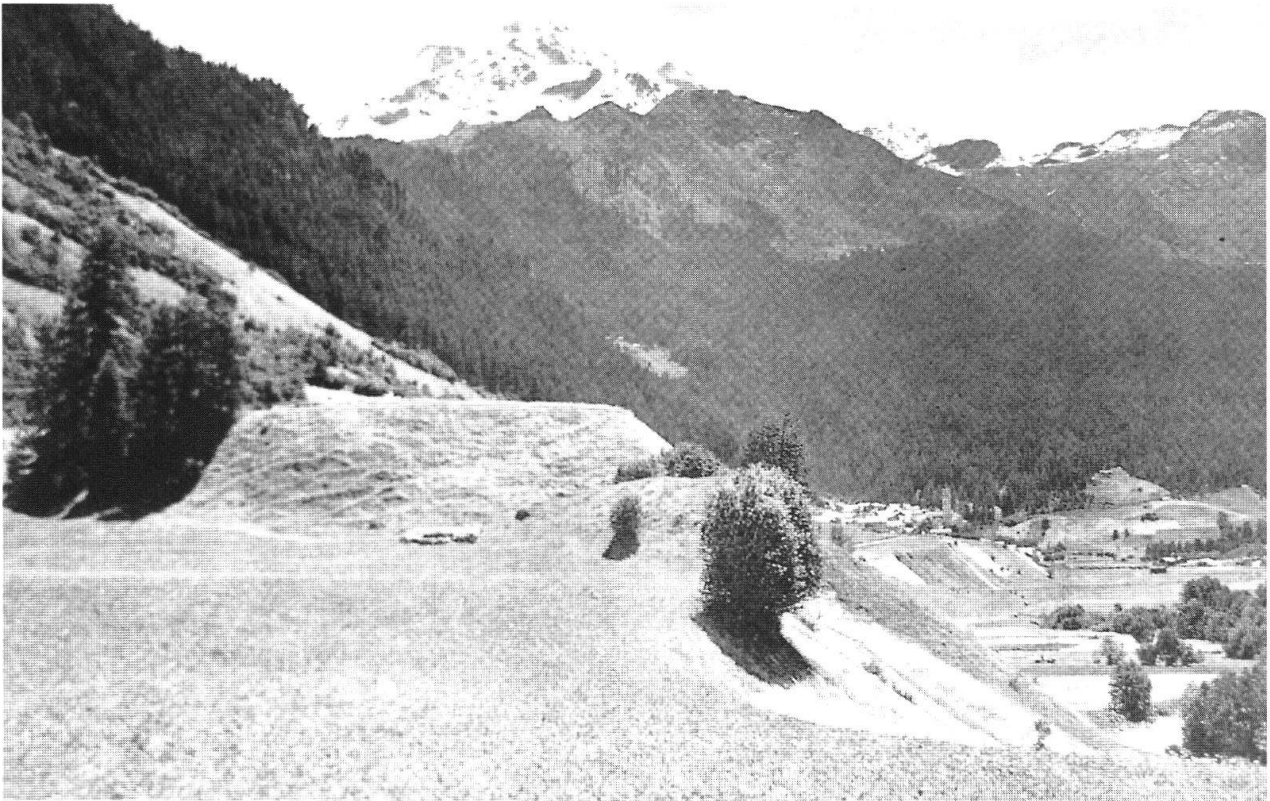
Il Padnal di Savognin, i cui scavi hanno dato alla luce reperti di ben cinque insediamenti dal Bronzo antico (2200-1600 a.C.) al Bronzo recente.