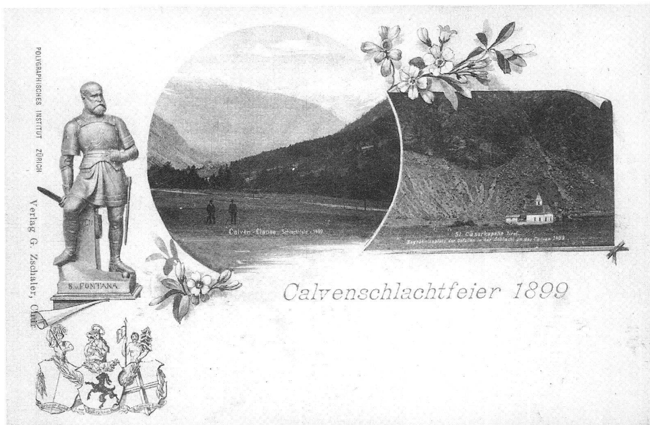
Cartolina ricordo del giubileo della Calven del 1899

cora numerose esecuzioni della musica di Barblan. Alcune marce e melodie tratte dal dramma di gala sono nel repertorio preferito di società musicali grigioni fino ai nostri giorni. L'eco della festa fu enorme e persistente nella pubblica opinione del Cantone e della Confederazione. Ancora per decenni, i testimoni di questo avvenimento rimasero entusiasti della sua grandiosa efficacia su migliaia di spettatrici e spettatori.