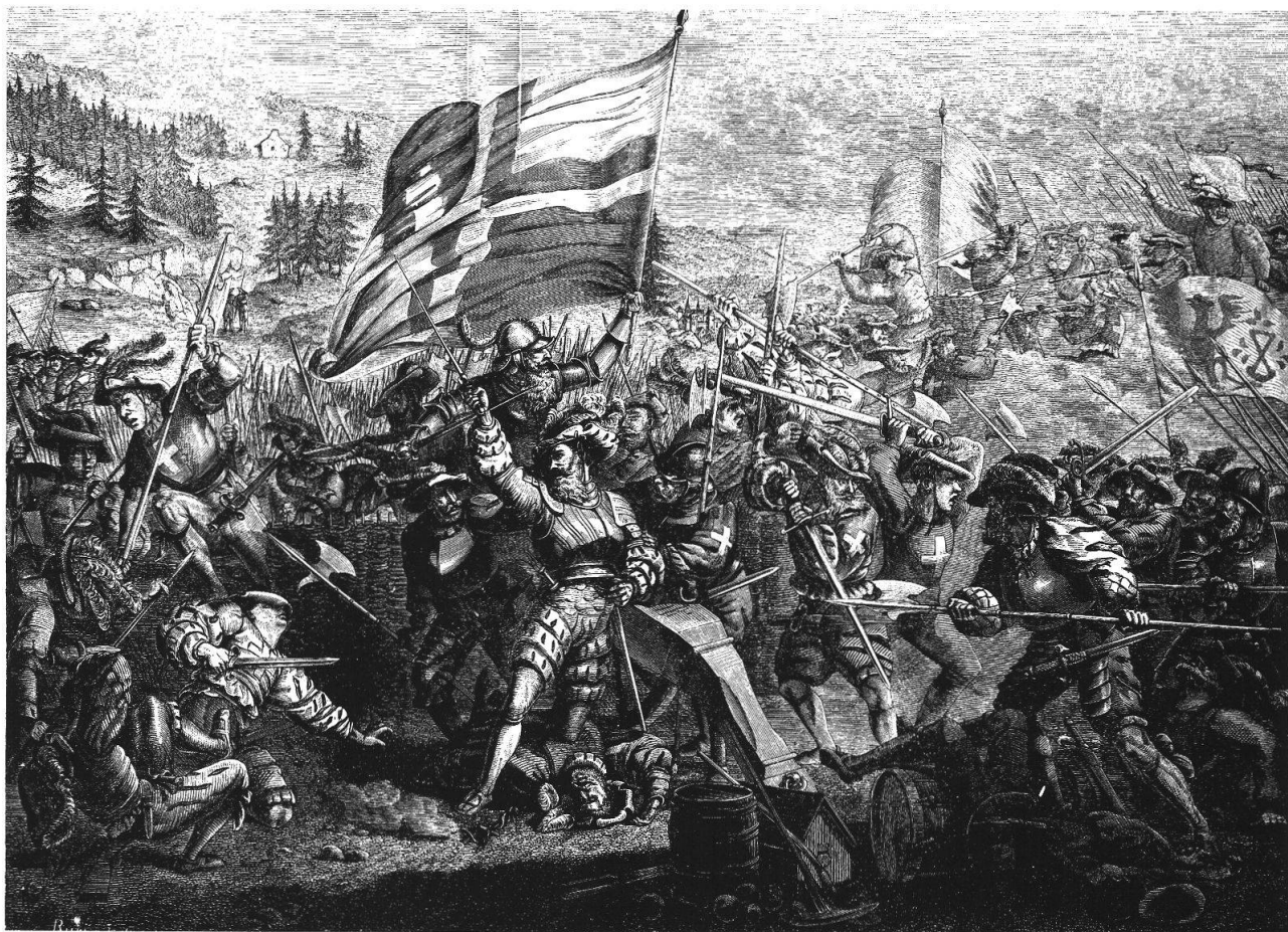
Benedetto Fontana durante la battaglia (per la fonte si veda la nota 4)

del XIX secolo, finché a Milano si trovò una relazione che confermava la morte del capitano grigione 2 .