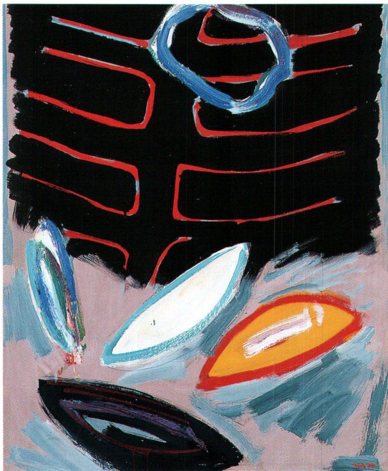
Paolo Pola, Vergehen , 1994, collezione privata

solitario, come disperso nella distesa bianca. Si staglia nel cielo vitreo e terso un'enorme nuvola, grigia ai lati e luminosa all'interno, potente metafora del duplice significato della morte che è fine e inizio di tutto, ultima tappa del percorso terreno e prima tappa della vita celeste. In tal modo l'eterno sembra aprirsi e preannunciarsi attraverso il nucleo centrale della nuvola, come un'apertura provvidenziale nel cielo rigido.