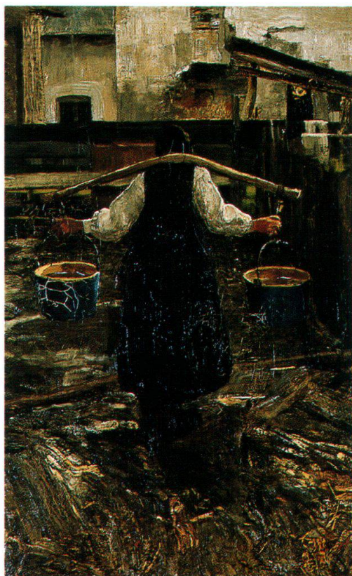
La portatrice d'acqua, [1886-87], Museo Segantini, San Moritz