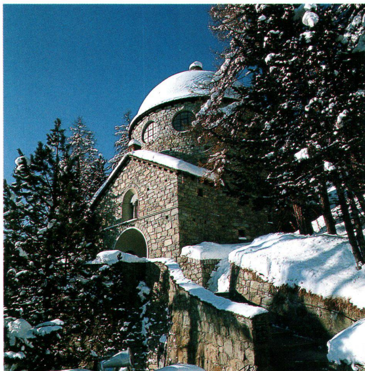
Museo Segantini, San Moritz

L'enorme riconoscimento attribuito a Segantini fu però dissonante: l'assommarsi di medaglie proveniva dalla cosiddetta parte «ufficiale» che seguiva la tradizione accademica (pertanto non sorprende affatto se di tanto il tanto l'artista venisse insultato quale pittore da salotto, quale «pompiere»). D'altro canto e allo stesso tempo, di lui si appropriò l'avanguardia, gli alfieri di un'arte nuova e progredita – in occasione della prima mostra della Secession viennese del 1898, Segantini fu festeggiato con una sala tutta dedicata a lui. Due anni dopo la sua morte, il trionfo dell'artista ebbe un seguito magnifico con numerose pubblicazioni ed esposizioni a Parigi e Vienna. La più grande retrospettiva, con 56 opere, ebbe luogo nel quadro della IX Esposizione d'arte della Vereinigung Bildender Künstler Österreichs alla Secession. Segantini era ritenuto il massimo pittore del simbolismo.