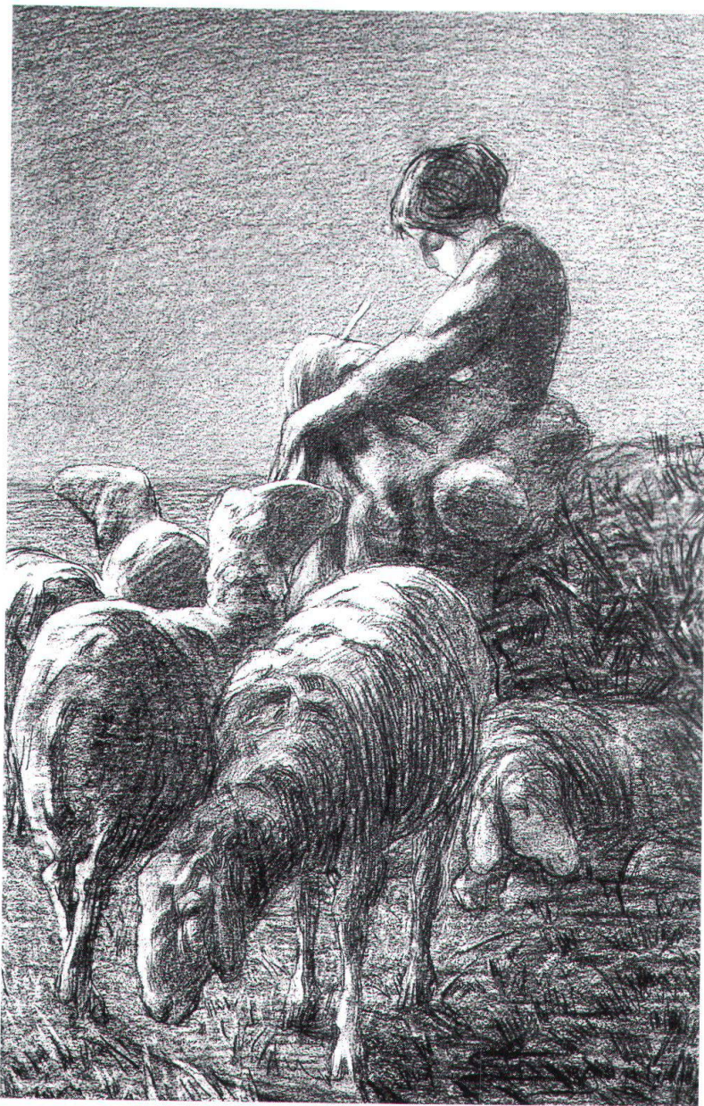
Pastorella sognante , [1886-87], Museo Segantini, San Moritz