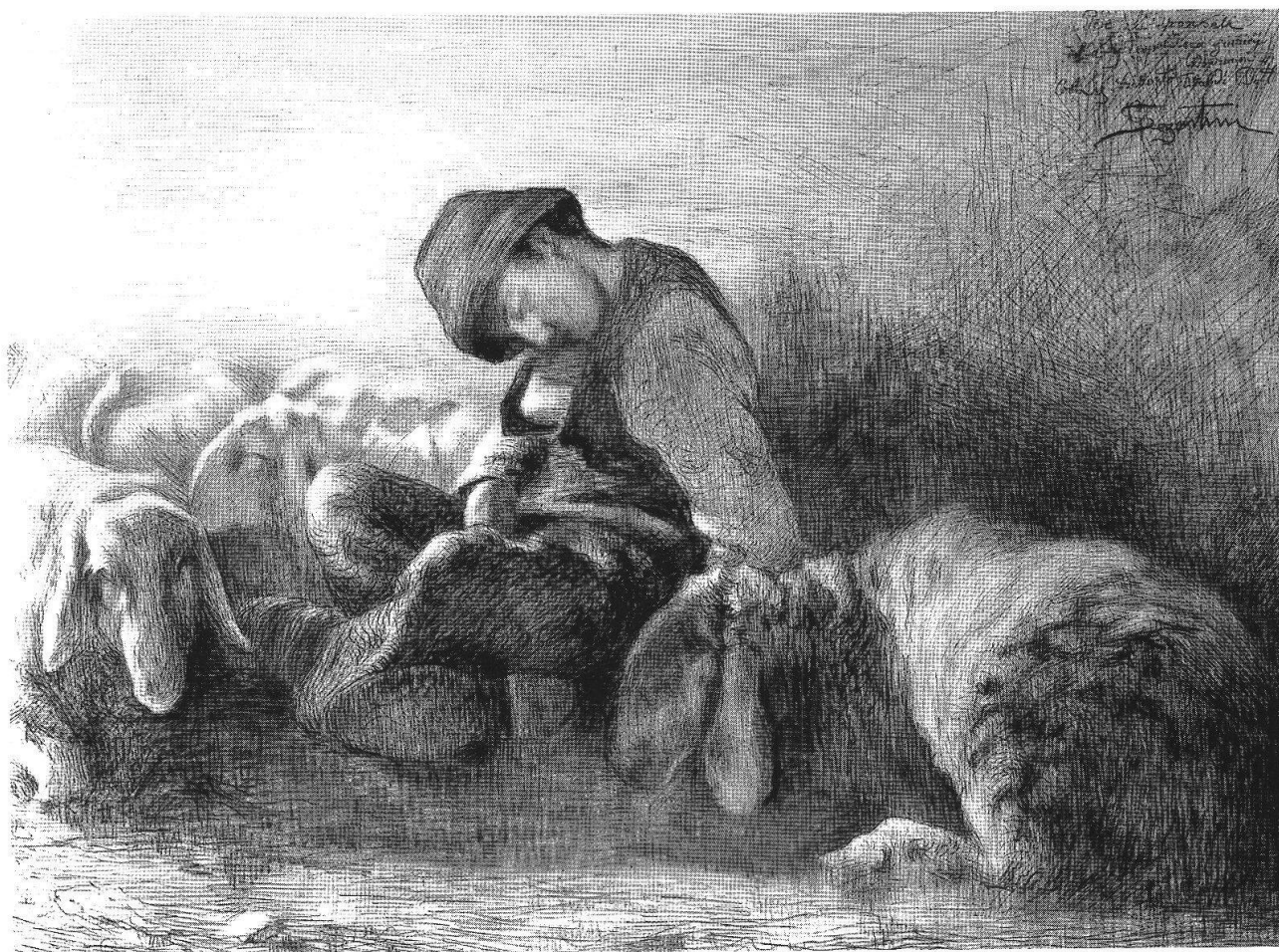
Pastore addormentato , [1882], Museo Segantini, San Moritz

Il ciclone portato dalle avanguardie non ha investito solo la realtà indagata ma anche, e soprattutto, la sensibilità ottica e percettiva di pubblico e critica. E proprio su questo vale la pena soffermarsi. Segantini – confrontato con le opere dei più giovani artisti europei – non fu più considerato moderno e innovatore. Mentre continuava ad essere amato dal grande pubblico, la critica più colta fu assorbita dalle novità sconvolgenti che il mondo dell'arte produceva ad una velocità straordinaria. Ogni nuovo secolo tende sempre a considerare sorpassato in tutti i sensi il precedente. Se Segantini fosse vissuto più a lungo, avrebbe probabilmente seguito – sempre a modo suo – il nuovo linguaggio dell'arte europea e mondiale. Avrebbe adattato il suo percorso alle istanze della modernità, rispettando sempre però i suoi incrollabili principi. Segantini, infatti, non ha mai smesso di seguire da lontano gli avvenimenti artistici a lui contemporanei. Si è parlato troppo di lui come un artista totalmente isolato dal mondo: ciò non risponde a verità. Segantini leggeva e si documentava, incontrava persone da tutta Europa 4 , intesseva amicizie con cui scambiare le proprie opinioni. Per questo non sarebbe rimasto estraneo all'arte in evoluzione.