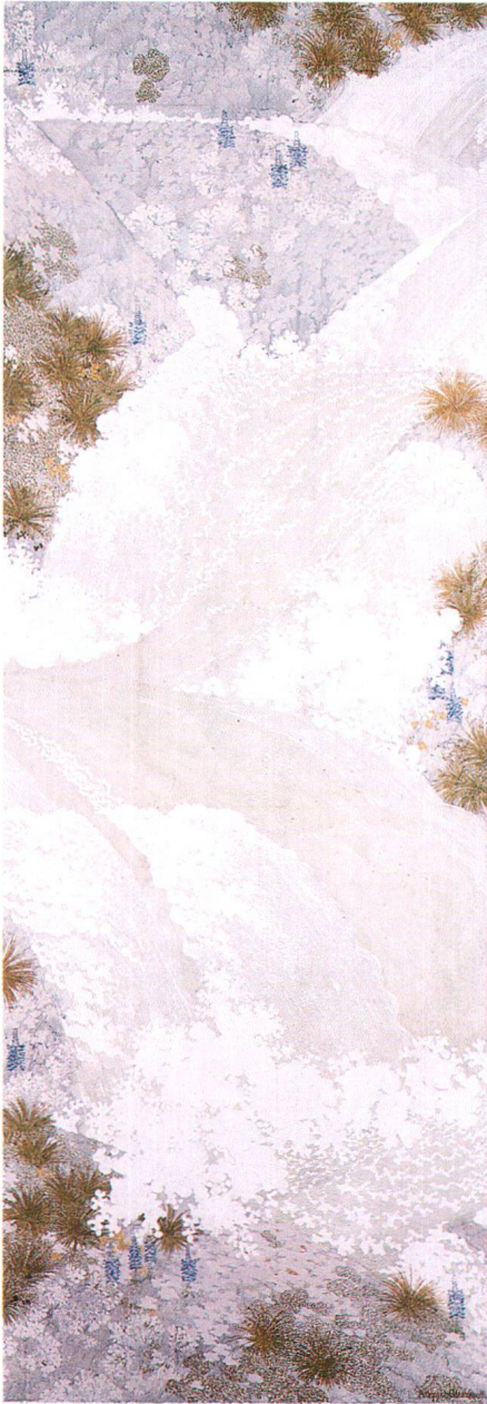
Augusto Giacometti, Ruscello di montagna, 1904, Museo d'arte grigione, Coira