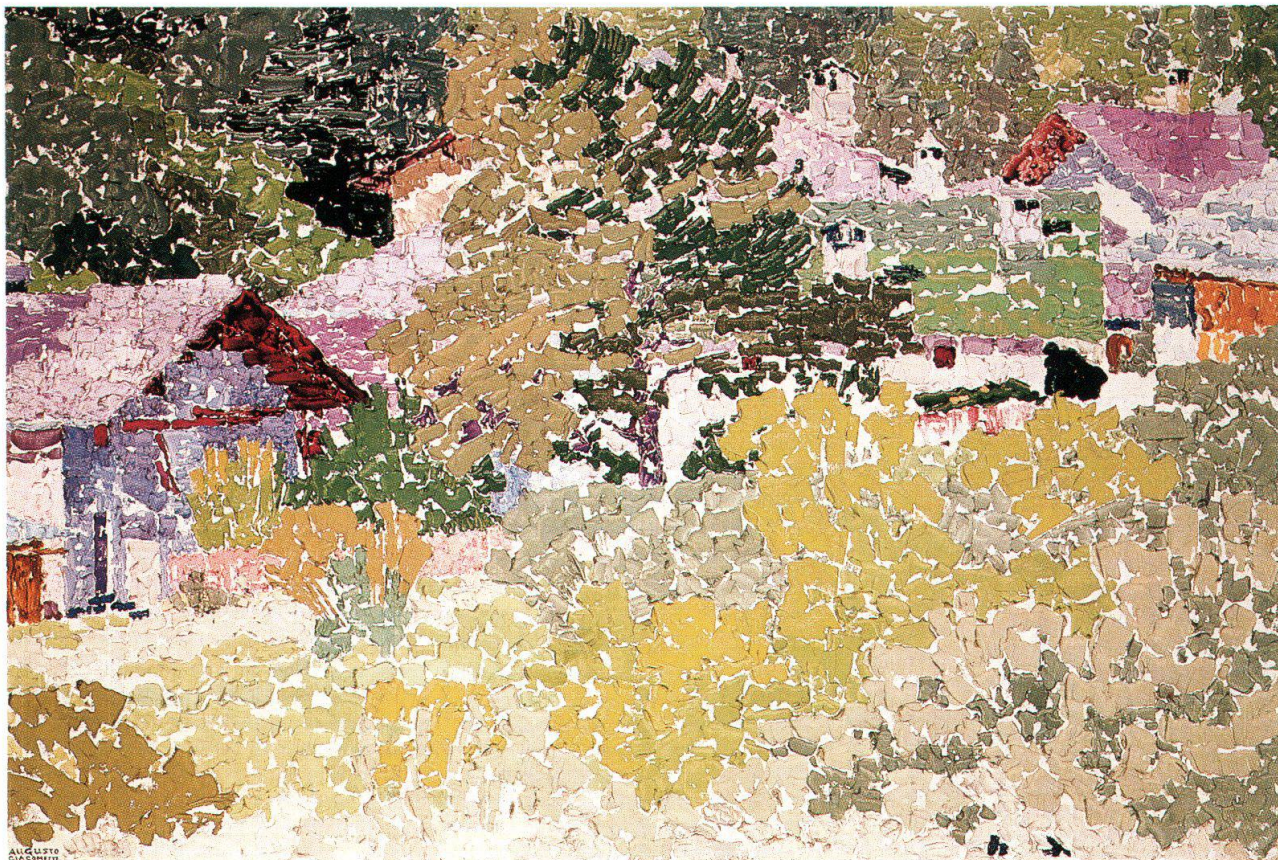
Augusto Giacometti, Stampa, 1912, Museo d'arte grigione, Coira