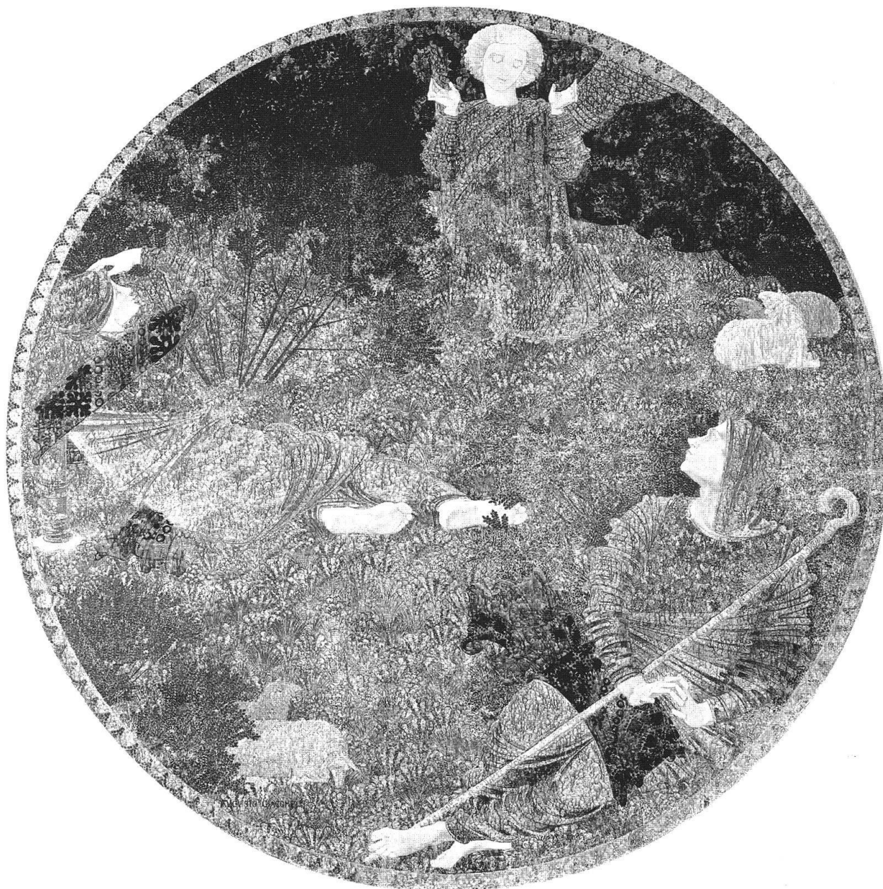
Augusto Giacometti, Annunciazione ai pastori, 1905, Museo d'arte grigione, Coira

la chiesa anglicana di San Paolo entro le Mura. Questa costante sensazione di delusione che provava fin dal momento in cui era giunto a Roma si ripeté anche alla vista degli affreschi dell'Angelico della Cappella Niccolina in Vaticano: 28