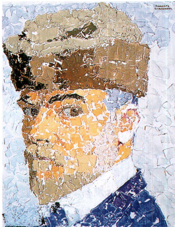
Augusto Giacometti, Autoritratto, 1910, Museo d'arte grigione, Coira