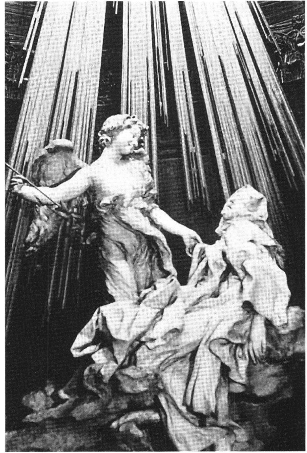
Bernini, Estasi di Santa Teresa (1647), Santa Maria della Vittoria, Roma

sottolinea il Migliorini, come termine tecnico locale. «Argomenti in barocco»: termine riferito alla logica medioevale, in particolare al sillogismo. Fulvio Testi scrive in una lettera (1641), nella quale parla dell'educazione del giovane Alfonso di Modena: «E che può risultargli del sapere se un argomento sia in forma o fuori di forma, se sia in barbara o in barocco?» Parole usate simbolicamente nelle polemiche antiperipatetiche per indicare una logica formale pura, lontana della realtà.