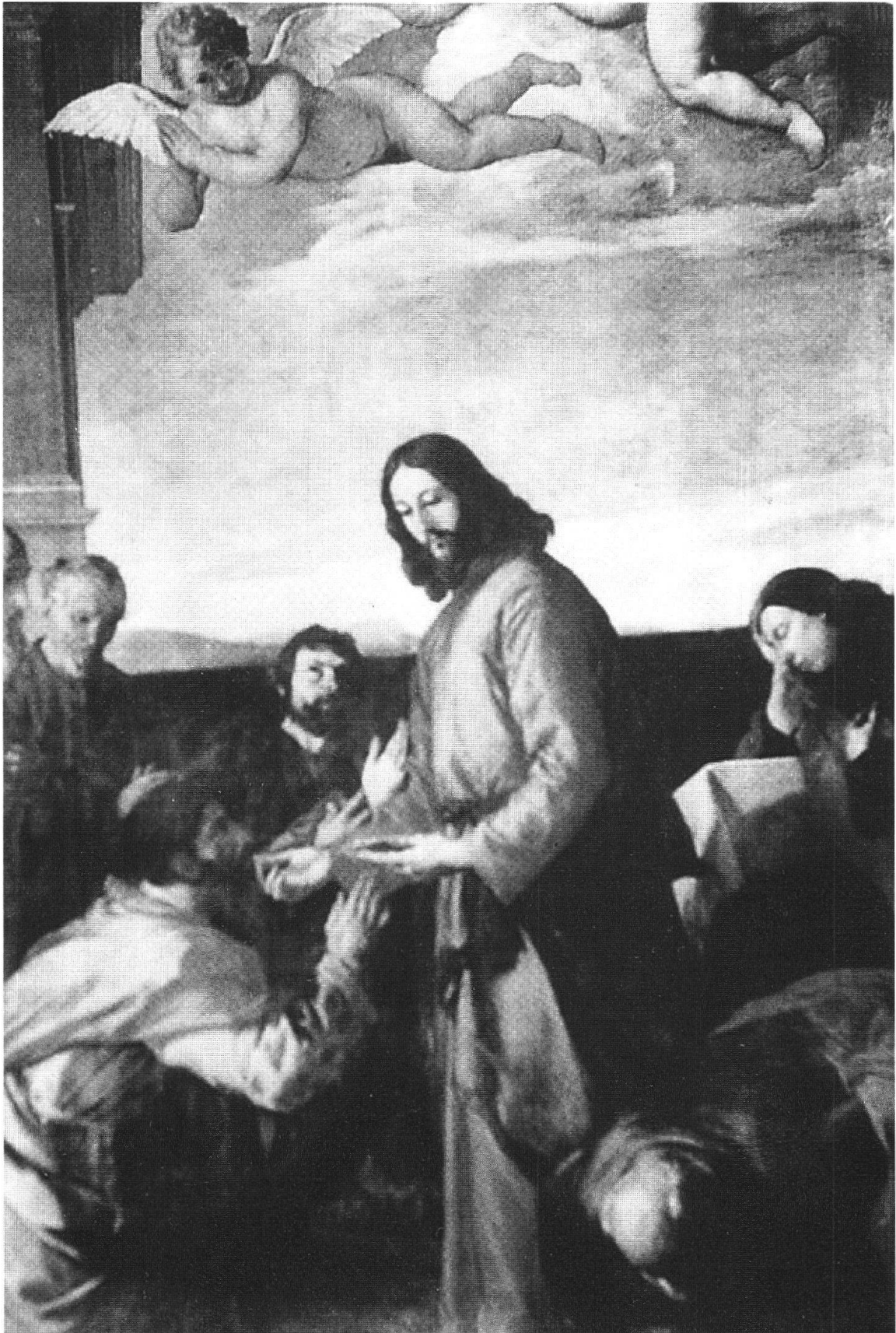
Ribera, L'ultima comunione degli Apostoli (1638-51), Certosa di San Martino, Napoli