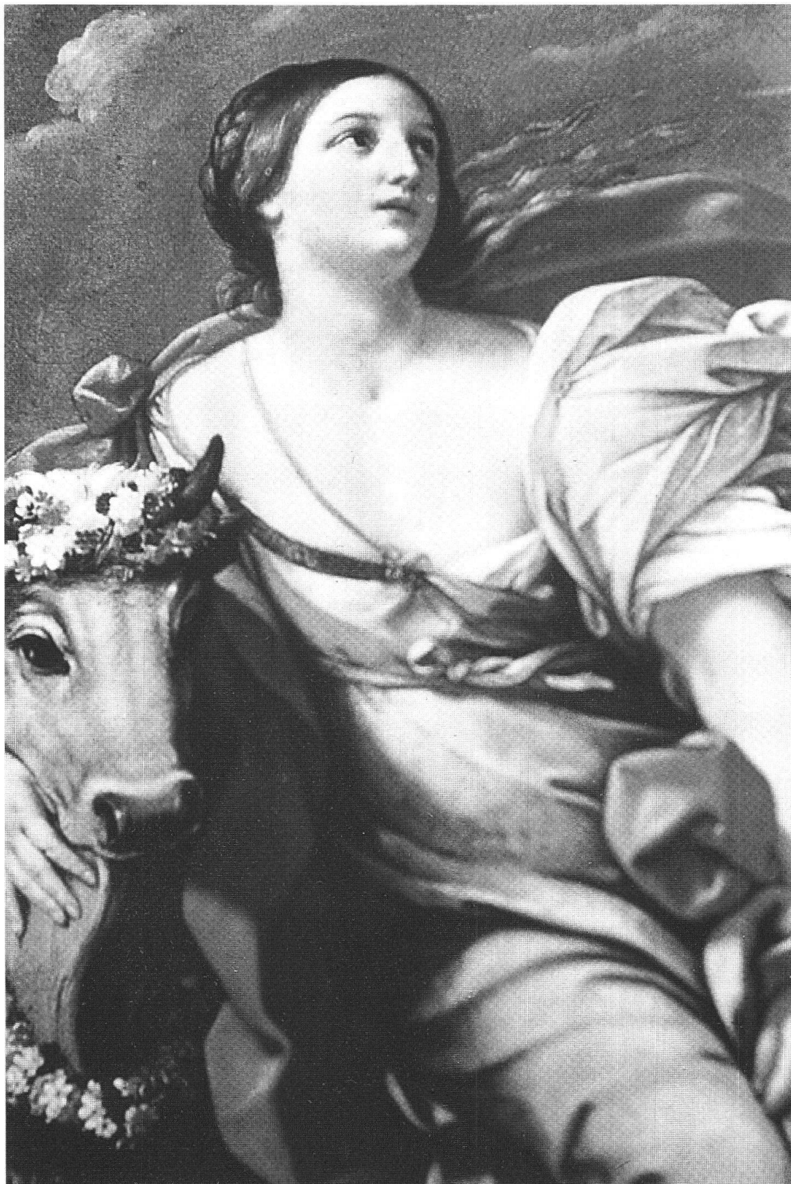
Reni, Il ratto di Europa, Museo delle Belle Arti, Tours