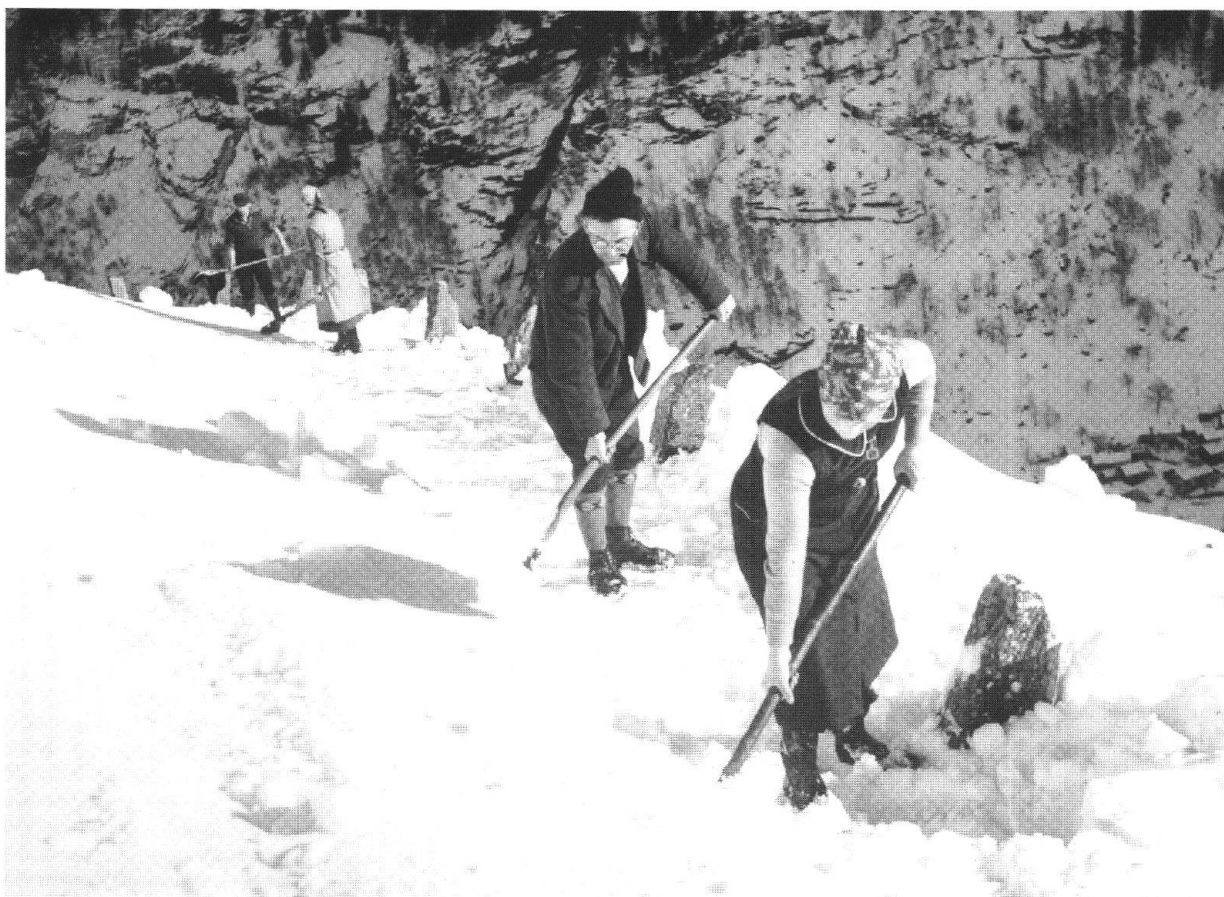
Storia dei Grigioni, Strassenräumung im Gemeinwerk, Landarenca, nach 1950, Vol. IV (Quellen und Materialien) , p. 198

aperto agli influssi e alla gente proveniente da fuori. Lo studio del mosaico grigione si condensa qui in un'attenta presentazione dei fatti, avanza prudenti valutazioni ricordando tuttavia i punti oscuri, le questioni rimaste ancora aperte.