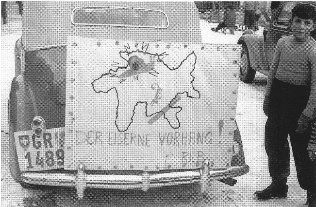
Storia dei Grigioni, St. Moritz, anni Quaranta o inizio degli anni Cinquanta: sfilata di protesta poschiavina contro le tariffe elevate della Ferrovia retica e per l'apertura invernale della strada del Bernina, Vol. III, p. 375

dell'istituzione politica cantonale riesce solo nel 1854 con la nuova Costituzione, che è però confrontata con la mancanza di mezzi finanziari e con le persistenti autonomie comunali. Negli ultimi decenni la situazione è di molto cambiata: l'apertura culturale, economica e sociale ha fatto maturare comportamenti più dinamici e meno campanilistici. La perdita della Valtellina, l'adesione alla Svizzera a inizio '800 e la mancanza di una trasversale alpina di base hanno fatto sì che i Grigioni guardassero sempre più verso nord.