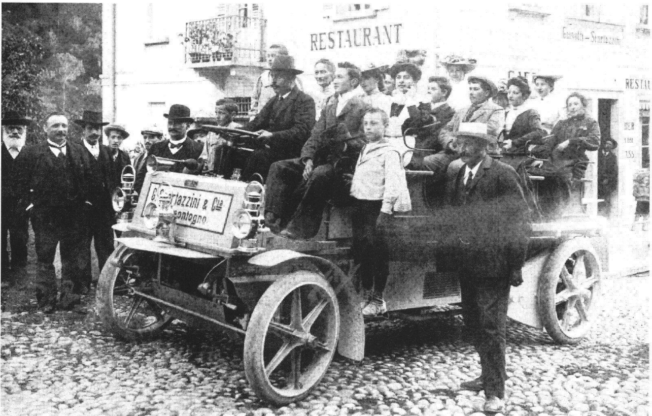
Storia dei Grigioni, Una delle prime automobili del mulino Scartazzini (Promontogno) a Castasegna , Vol. III, p. 72

da forti sconvolgimenti di carattere religioso-politico che lo costringeranno a rivedere le relazioni con la casa d'Austria a proposito dei territori sottomessi. La Rivoluzione francese «castiga» doppiamente le Tre Leghe: prima le priva della Valtellina (1797) e poi le fonde nel Canton Rezia (1798) per incorporarle nella Repubblica Elvetica. Tuttavia la fine ufficiale del Libero Stato sarà decretata nel 1803 con l'adesione alla Confederazione che non comporta però cambiamenti economico-sociali rilevanti per il nuovo Cantone.