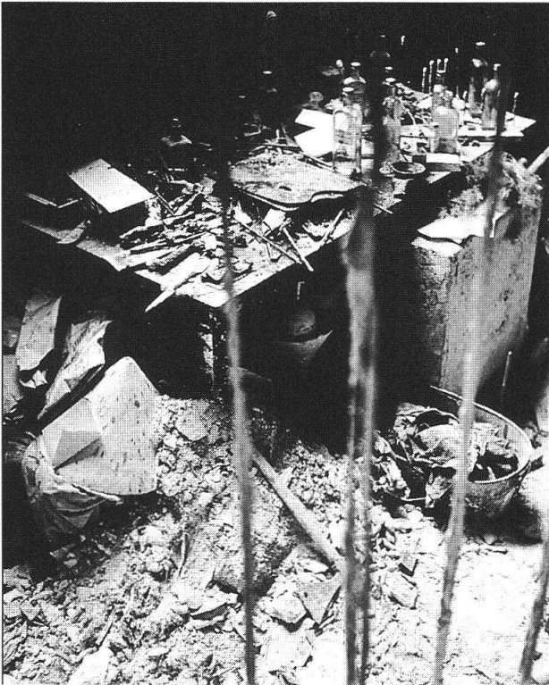
Ernst Scheidegger, Atelier, intorno al 1960, Fondazione svizzera per la fotografia, Zurigo

comune. È insomma rimasto sempre uno dei loro e per morire è tornato a casa, alle sue origini, per poter essere sepolto accanto ai suoi familiari nel cimitero di Borgonovo. C'erano in fondo in lui due anime: per lavorare e creare aveva bisogno di entrambi. Non tornava infatti in Bregaglia solo per starsene con le mani in mano e godersi la quiete delle montagne. D'altra parte per arrivare dove è arrivato aveva bisogno anche del fermento e degli stimoli di una metropoli, di una capitale dell'arte e della cultura.