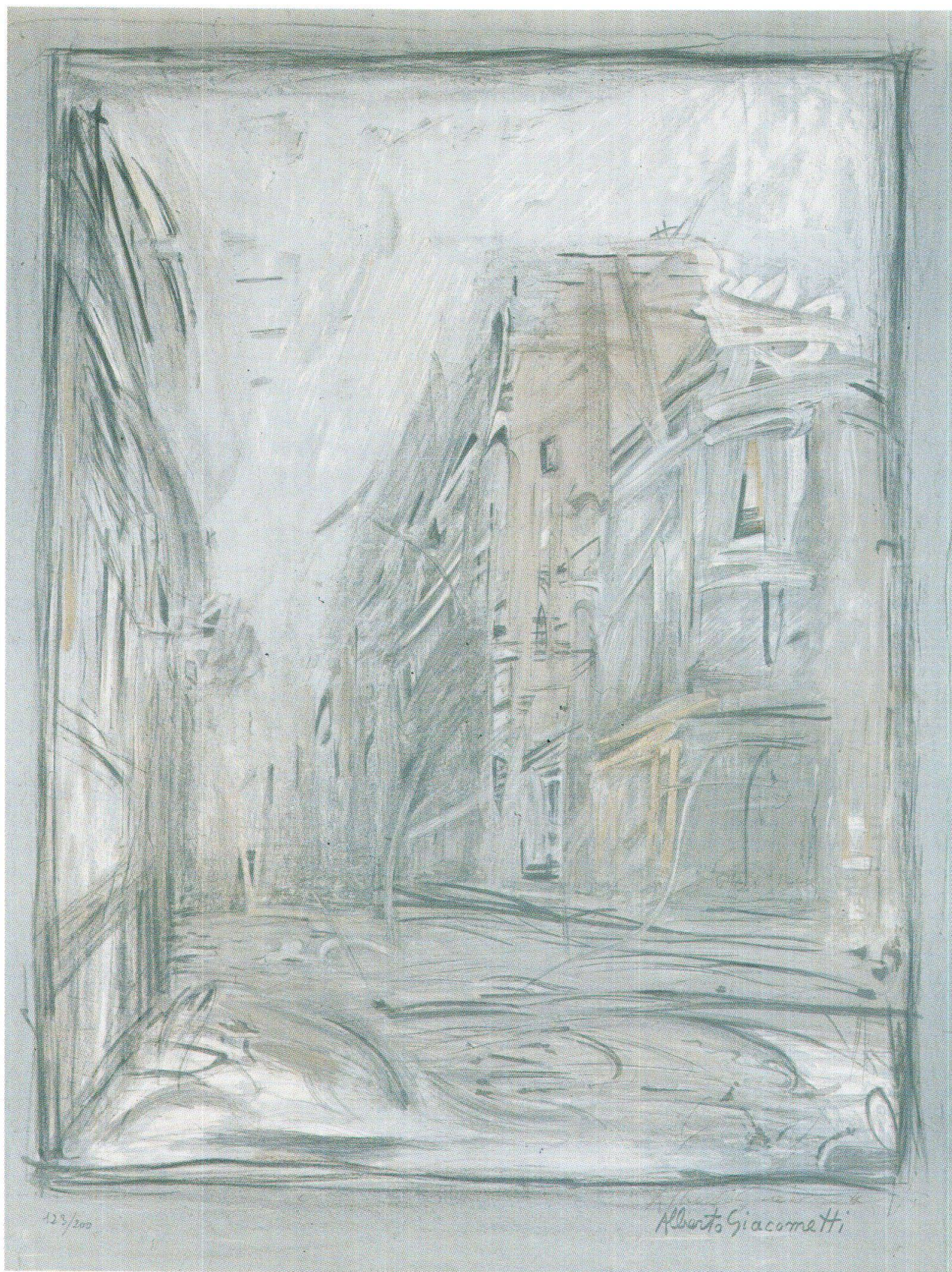
Alberto Giacometti, Rue d'Alésia, 1954, Museo d'arte grigione, Coira