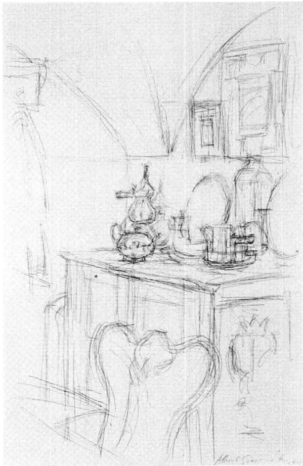
Alberto Giacometti, Natura morta nel vano dietro la cucina nella casa a Stampa, 1955, Collezione E.W.K., Berna

un collezionista privato americano, adesso è stato venduto in Europa ed è la prima volta che può essere ammirato in un museo del vecchio continente.