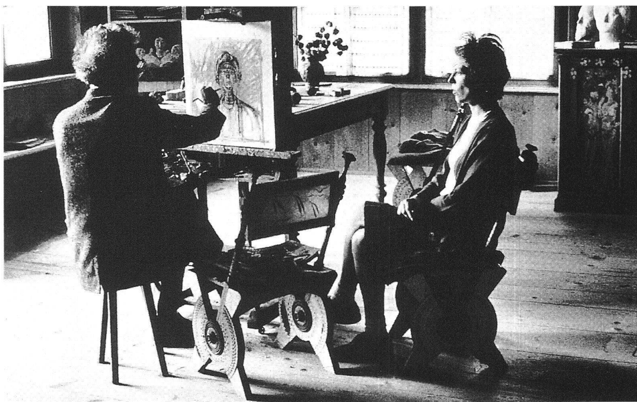
Giacometti nel suo Atelier a Maloja, 1960

non quelli che ritraggono le rues parigine. Nella mostra sono fra l'altro anche esposti alcuni dipinti realizzati da un Alberto appena 14enne. Si tratta di lavori nei quali è possibile cogliere l'influsso che ha esercitato su di lui la straordinaria natura della Bregaglia. Un influsso che non si attenuerà mai nel corso della sua esistenza. Alberto Giacometti infatti manterrà un rapporto emotivo alquanto stretto con il villaggio natale. In generale comunque sono i riferimenti tematici a permetterci di individuare con sicurezza dove sono state create le singole opere. E sono tanti i lavori che si riallacciano ai due poli nei quali ha vissuto Giacometti. Ma mai prima d'ora in una mostra si era pensato di accostare l'opera bregagliotta a quella parigina, evidenziando così le differenze e i contrasti, ma anche tutto quello che unisce i due universi giacomettiani.