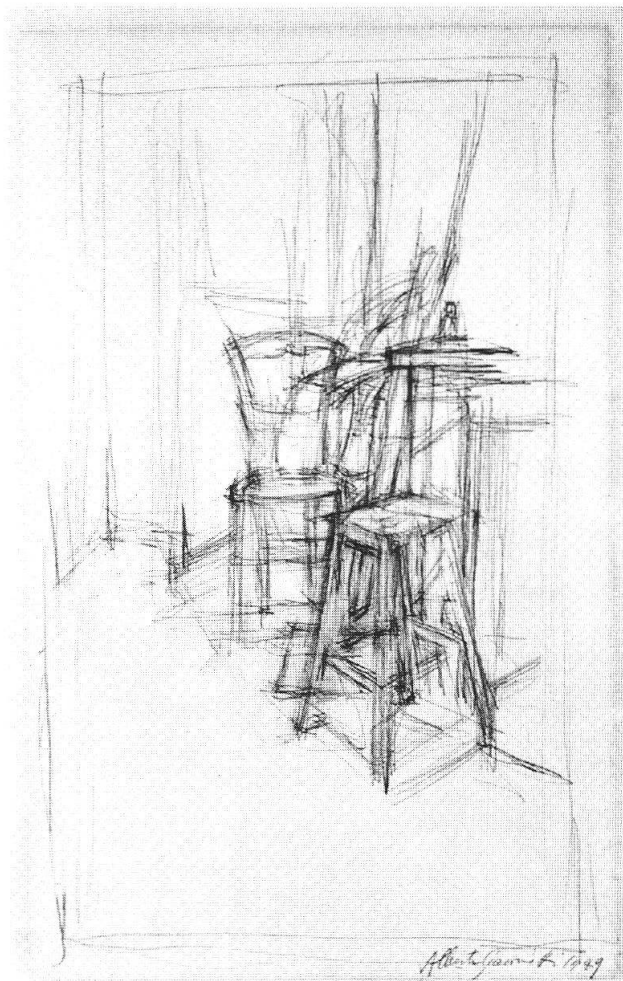
Alberto Giacometti, Intérieur I, 1949, Collezione privata