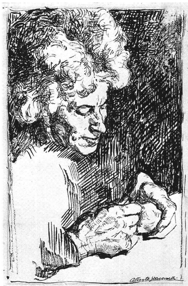
Alberto Giacometti, Ritratto della madre, intorno al 1918, Kunstmuseum Bern