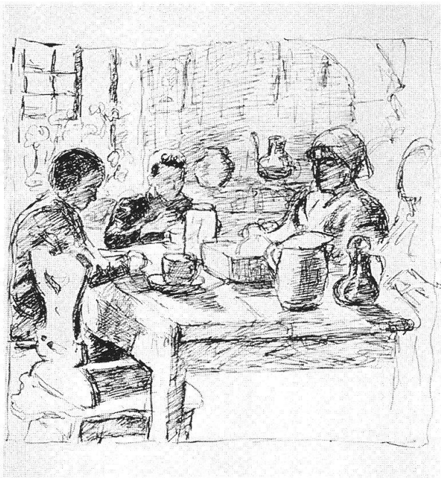
Alberto Giacometti, La madre con i suoi bambini al tavolo nella cucina, 1918, Collezione privata

Oltre alle importanti retrospettive appena citate, vorrei ricordarne altre due, che si terranno a Zurigo e al "Museum of Modern Art" di New York l'anno prossimo, per sottolineare il centenario della nascita dell'artista. Qui a Coira non possiamo certo permetterci qualcosa del genere: innanzitutto per ovvi motivi finanziari, ma anche perché non disponiamo degli spazi adeguati per ospitare esposizioni di tale portata. Siamo così stati costretti a concentrarci su un tema determinato; era però anche nostra intenzione presentare una rassegna dell'intera opera dell'artista. Le 160 opere esposte, sculture, dipinti, acquerelli, tempere, disegni, litografie e fotografie, illustrano il percorso artistico iniziato già nella sua infanzia e conclusosi negli anni '60, quando aveva ormai raggiunto fama internazionale. E i due poli tra cui Alberto Giacometti ha vissuto e operato sono in fondo solo due: Stampa, il natio villaggio natale sperduto nelle Alpi grigionesi, e la sua patria d'adozione, Parigi. Due universi che non potrebbero essere più diversi l'uno dall'altro. Il nostro obiettivo era proprio quello di mettere in luce gli influssi di questi due poli sull'opera di Giacometti. Non si tratta dunque di una semplice rassegna di paesaggi o di pitture d'interni realizzati in Bregaglia o a Parigi.