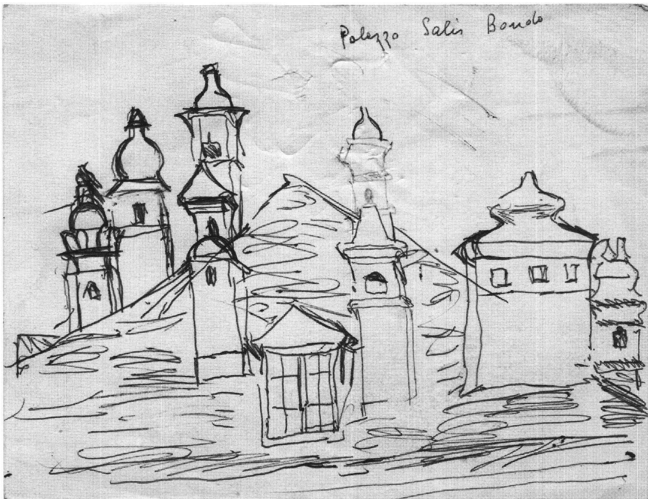
Varlin, Palazzo Salis di Bondo, ca. 1970, penna a sfera su carta, 13.7x17.8 cm, collezione privata