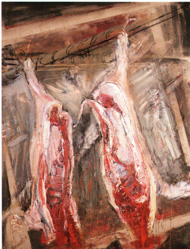
Varlin, Il maiale squartato, 1972, olio e carboncino su tela incollato su legno compensato, 180x140 cm, collezione privata (cat. 1343)