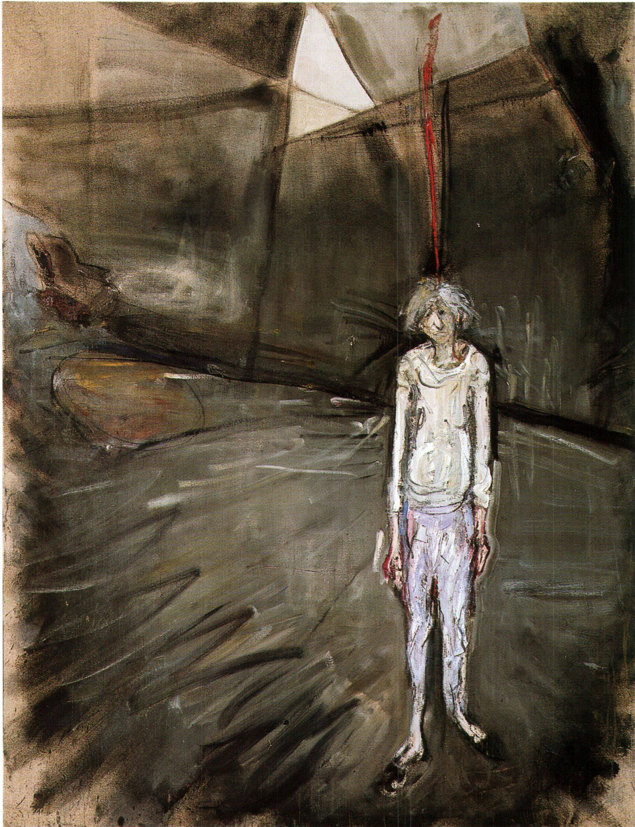
Varlin, Erna, ca. 1975, olio e carboncino su juta, 218.5x170.5, in deposito presso il Museo Cantonale d'Arte di Lugano (cat. 1358)