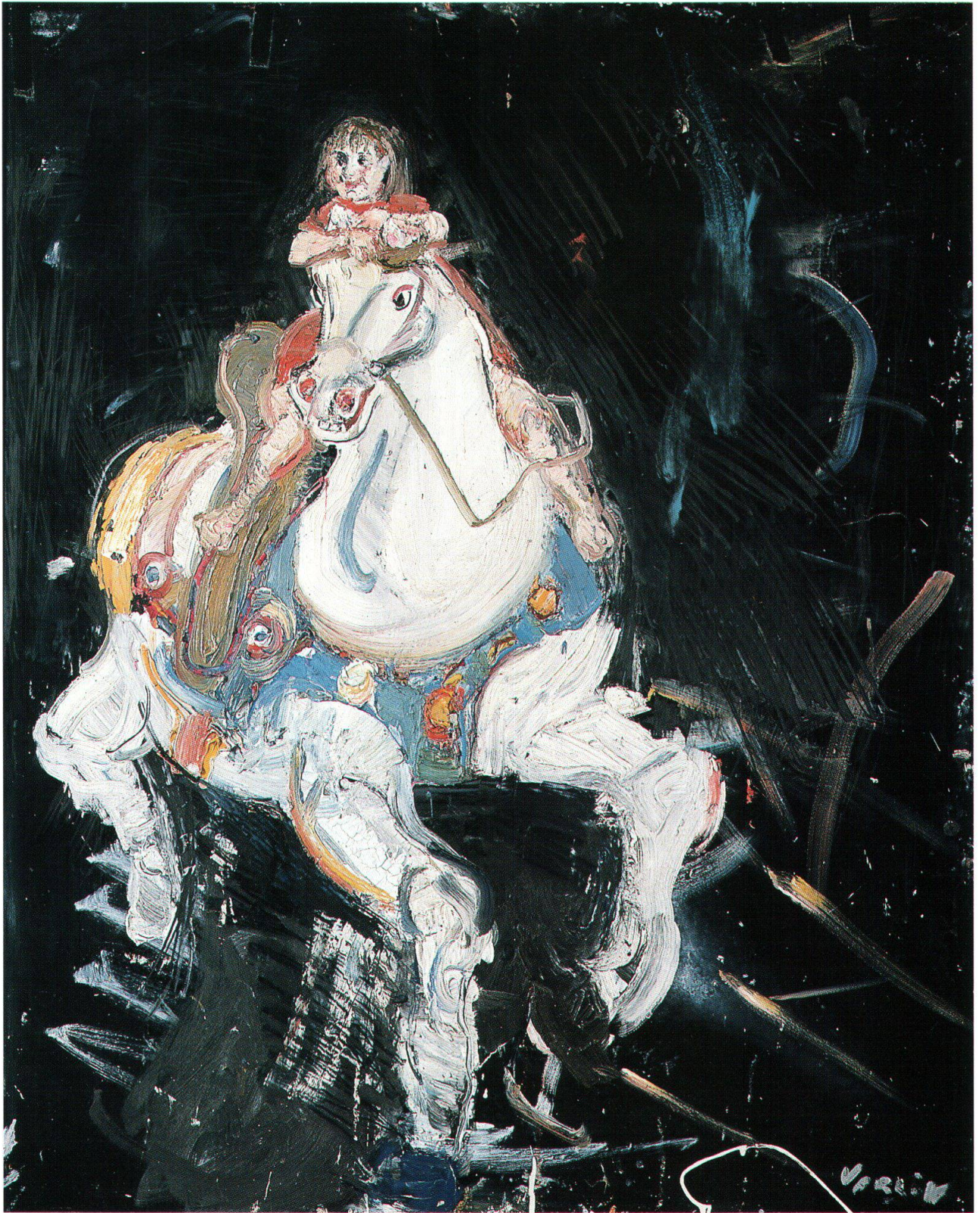
Varlin, Patrizia sul cavallo a dondolo, 1971, olio su formica incollato su legno compensato, 132.5x112 cm, in deposito presso il Museo Ciäsa Granda di Stampa (cat. 1288)