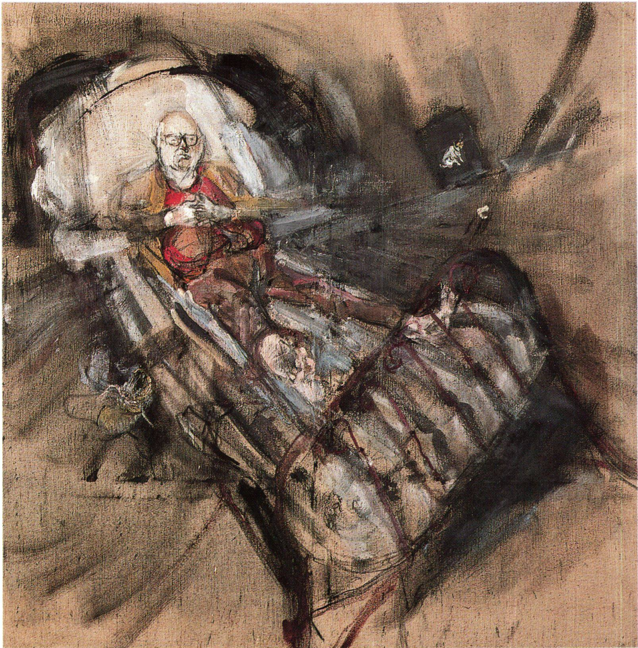
Varlin, Friedrich Dürrenmatt sul letto, 1974-75, olio e carboncino su tela, 181x180.5 cm, collezione della Città di Zurigo (cat. 1366)

Varlin non dimenticherà mai l'orazione funebre tenuta dal rabbino al funerale di sua madre: «[...] Il funerale non è stato, come la nostra cara mamma lo avrebbe meritato, il rabbino, che non era stato sufficientemente informato, ha tenuto un'orazione per me, piena di osservazioni presuntuose e fuori luogo [...]» 1 . Per questo motivo Varlin aveva sempre detto di non voler nessun rabbino alla sua tomba, visto che aveva già avuto la sua orazione funebre quando era in vita. Al posto del rabbino a dargli l'ultimo saluto sono due amici, Giovanni Testori e Friedrich Dürrenmatt.