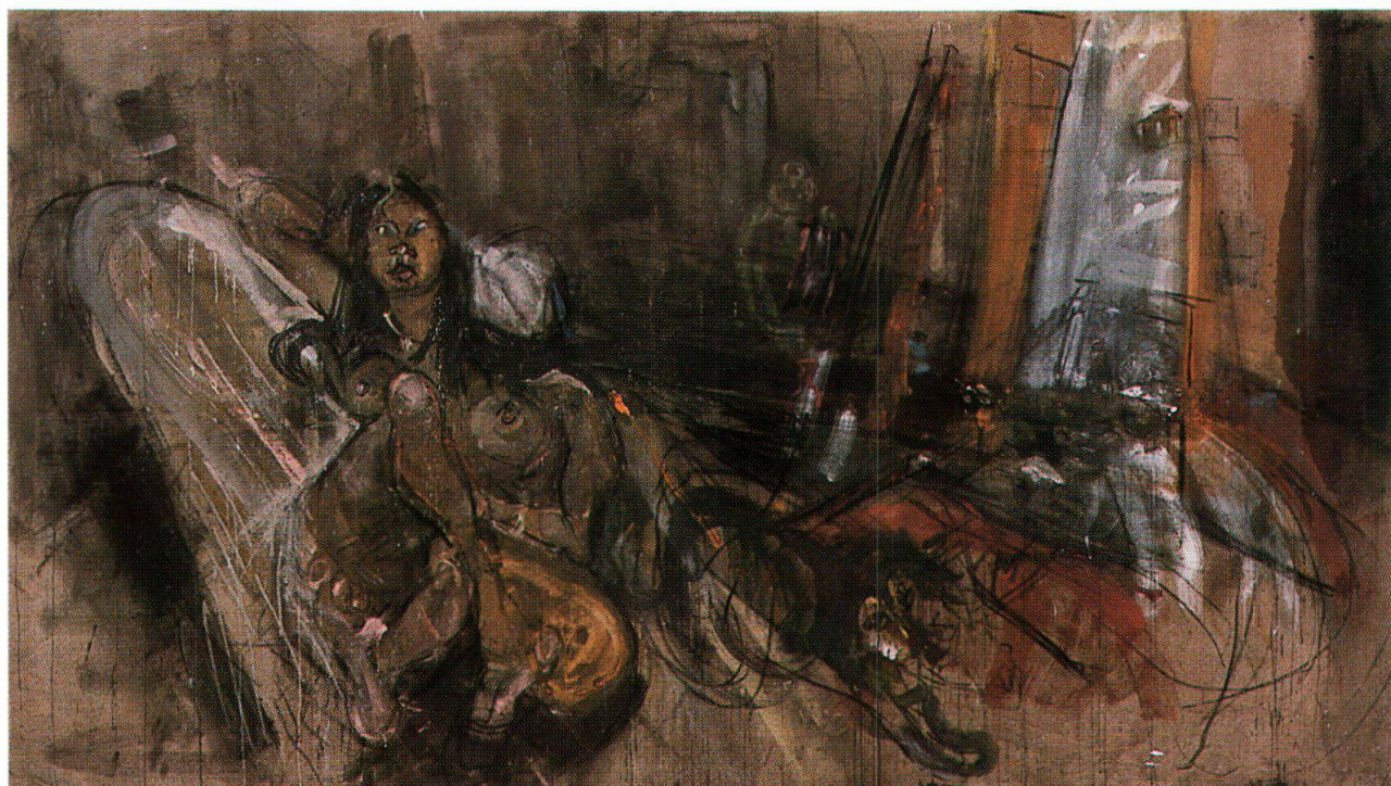
Varlin, La thailandese Tui-Tui nell'atelier di Bondo, 1973-74, olio e carboncino su tela, 170x300 cm, collezione privata (cat. 1349)

Si passa ancora una volta in rassegna tutto ciò che ha occupato Varlin artista per una vita intera - il ritratto di singoli e di gruppi e l'autoritratto, piuttosto raro, il paesaggio e gli oggetti quotidiani - ma ciò che crea ora, a Bondo, non è mera continuazione. Ciò che dipinge si esistenzializza. È come se ripetesse quanto lo interessava in