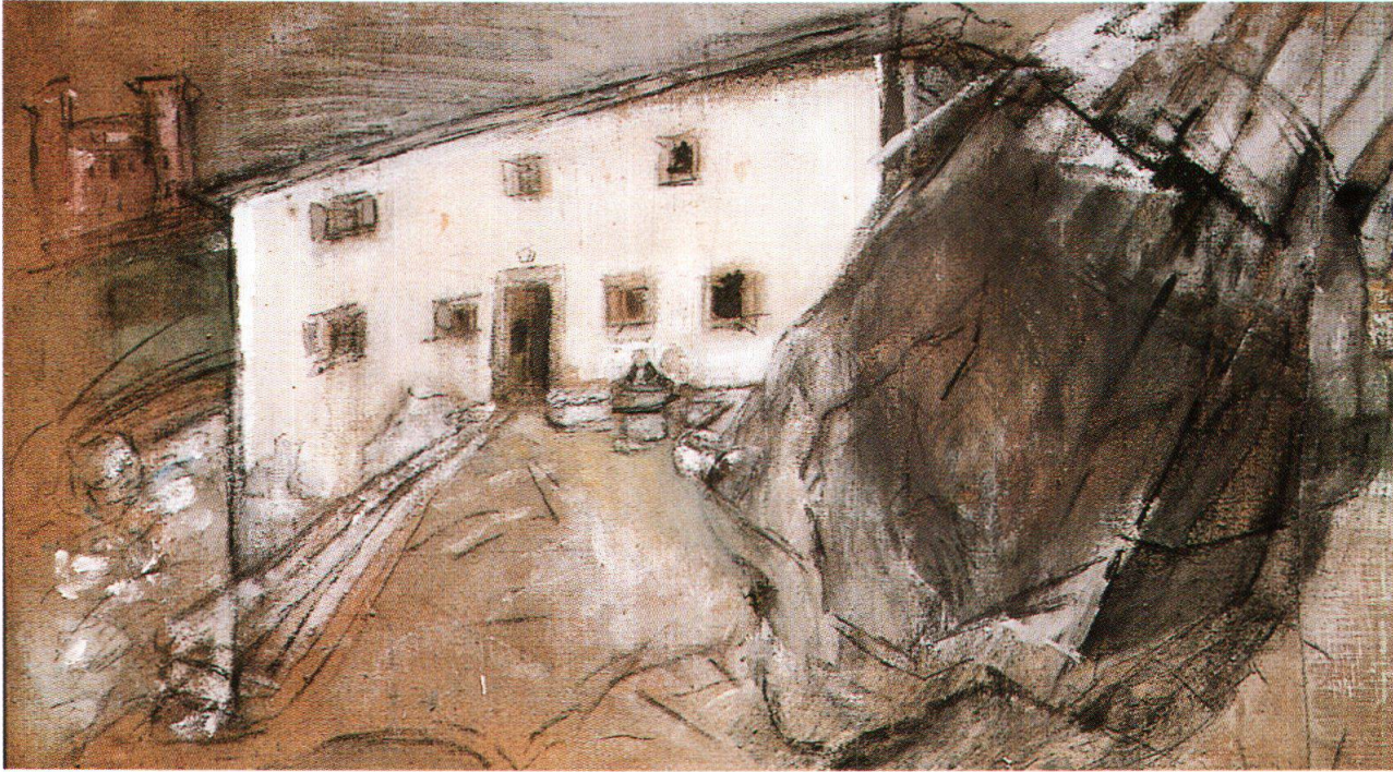
Varlin, Casa Palü a Stampa, 1970, olio e carboncino su tela, 100x170 cm, collezione privata (cat. 1261)

tale lo ha rappresentato Ludy Kessler nel suo film - si pensi alla spaghiettata orgiastica o ai quadri puliti nella lavatrice. Ma sono atti di dissimulazione. Ovviamente anche lui nascondeva dietro la maschera delle pagliacciate la propria sensibilità ferita. E di ferite ne ha subite, anche se solo raramente parlava del fatto di essere ebreo nella nostra società, e trattato come tale.