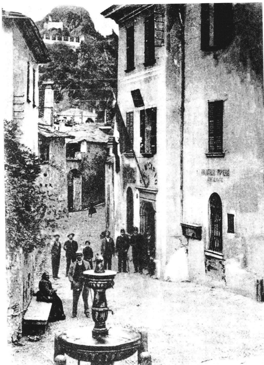
Chiavenna, Piazza San Péder, 1899