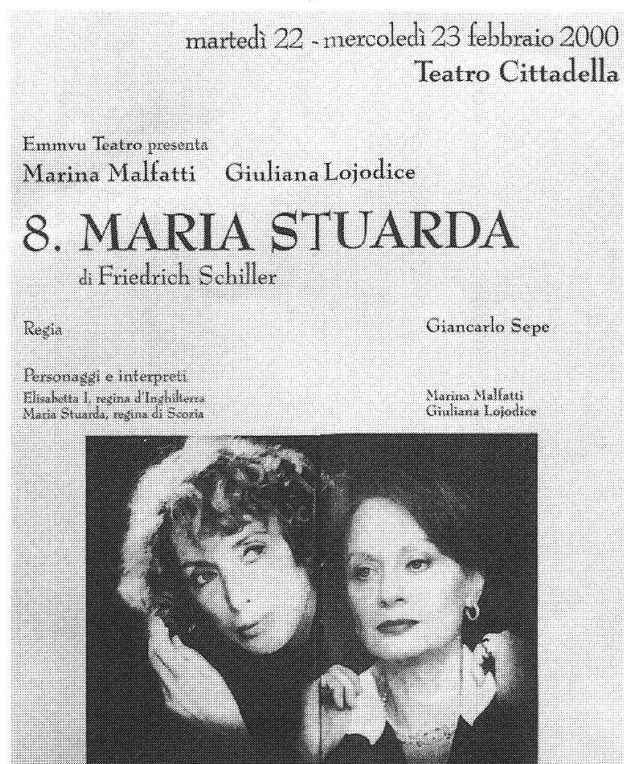
La locandina della tragedia di Schiller