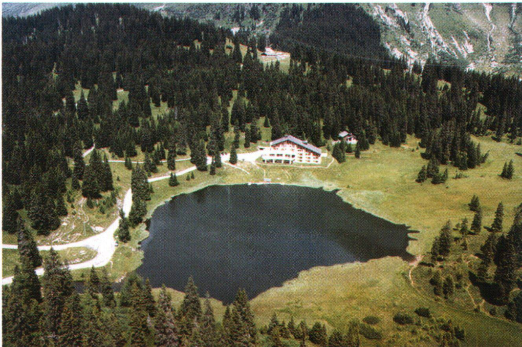
Figura 1: Veduta panoramica del Lago Doss e parte de suo bacino imbrifero.