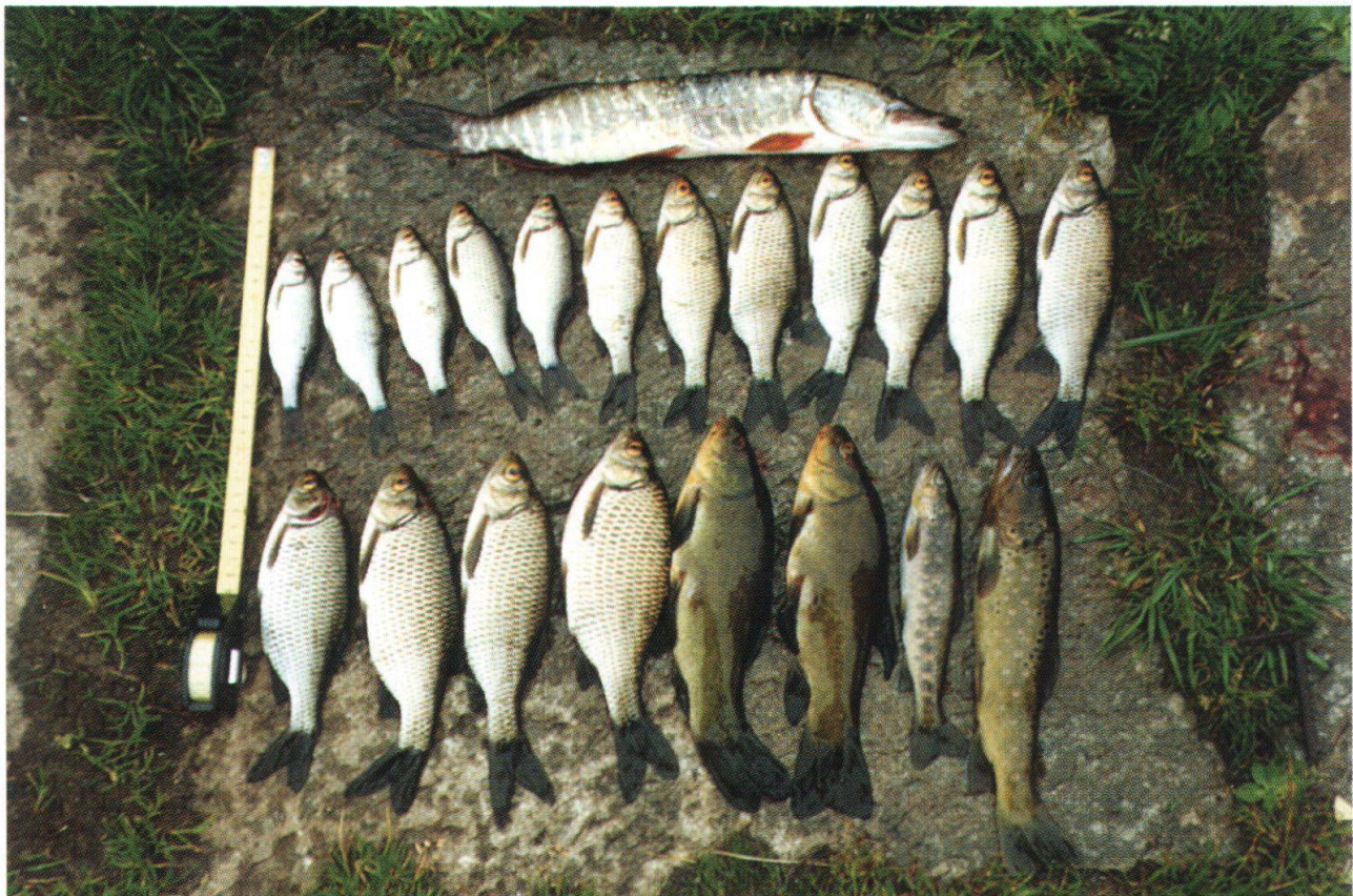
Figura 4: Catture tramite pesca elettrica di pesci del Lago Doss e dell'affluente principale.