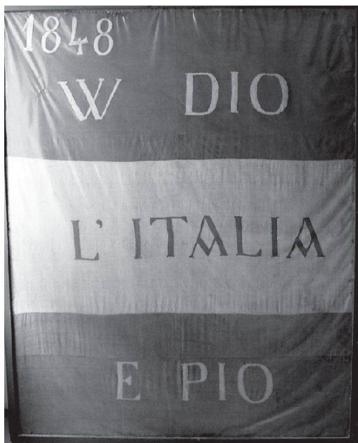
Bandiera nazionale tricolore (con le bande orizzontali, dal momento che non era ancora stata codificata in maniera definitiva), utilizzata nella «rivoluzione» di Chiavenna del 1848, conservata presso la Società Democratica Operaja di Mutuo Soccorso di Chiavenna.

Nel frattempo, nel clima della «Primavera dei popoli» e delle insurrezioni in tutta l'Europa continentale (che mettono in crisi gli imperi multinazionali, come l'asburgico), scoppia la Prima Guerra d'Indipendenza contro l'Austria, con la partecipazione di molti stati italiani: in primis il regno di Sardegna, ma anche il granducato di Toscana, lo Stato della Chiesa e il Regno delle Due Sicilie.