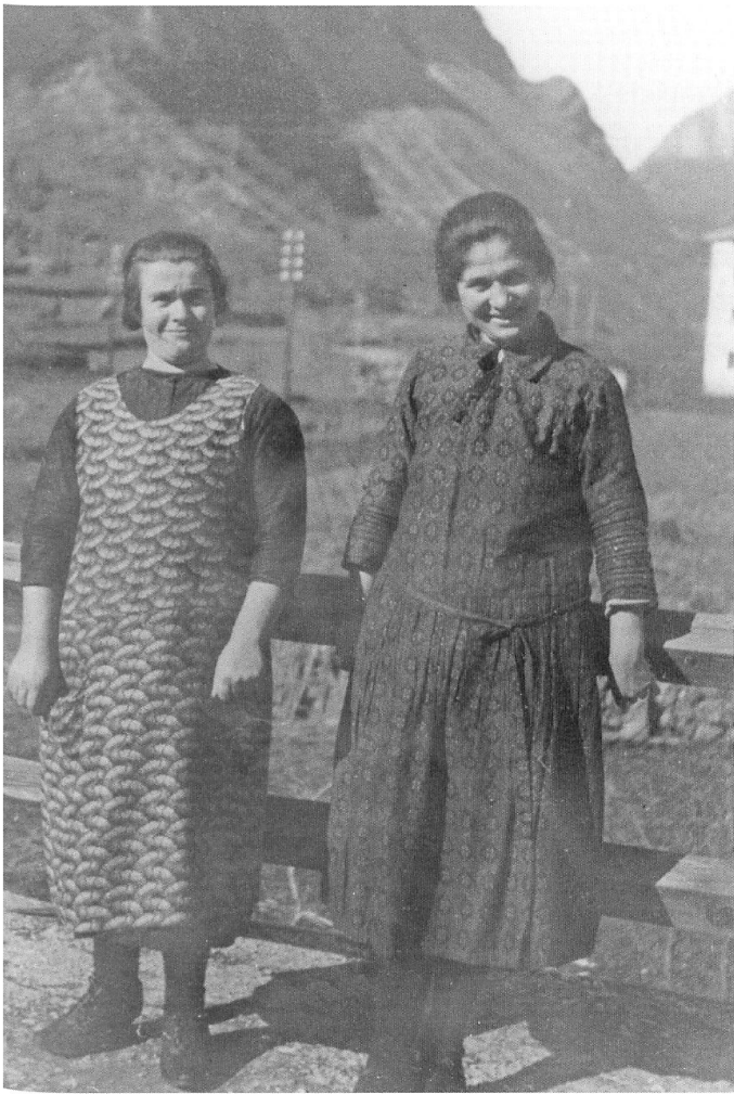
Due donne d'Aprica d'emigrazione anteguerra