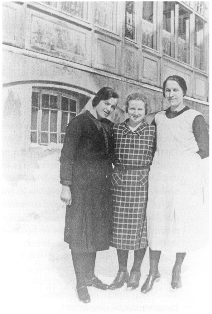
Tre donne d'Aprica d'emigrazione anteguerra