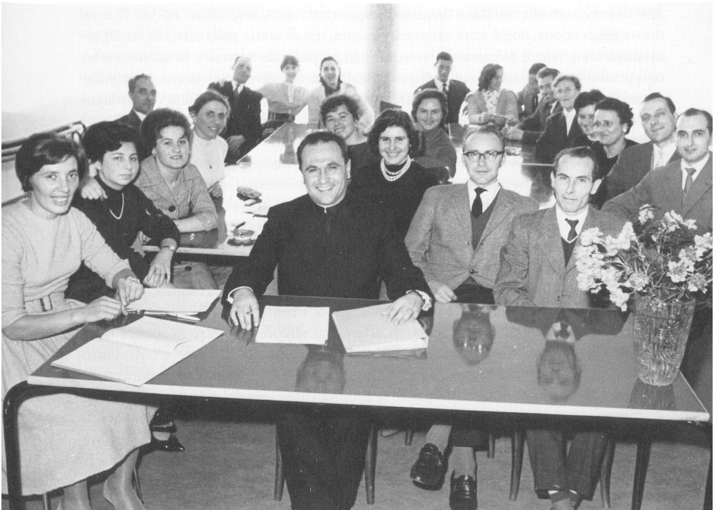
I collaboratori della Missione di Berna per il Cantone