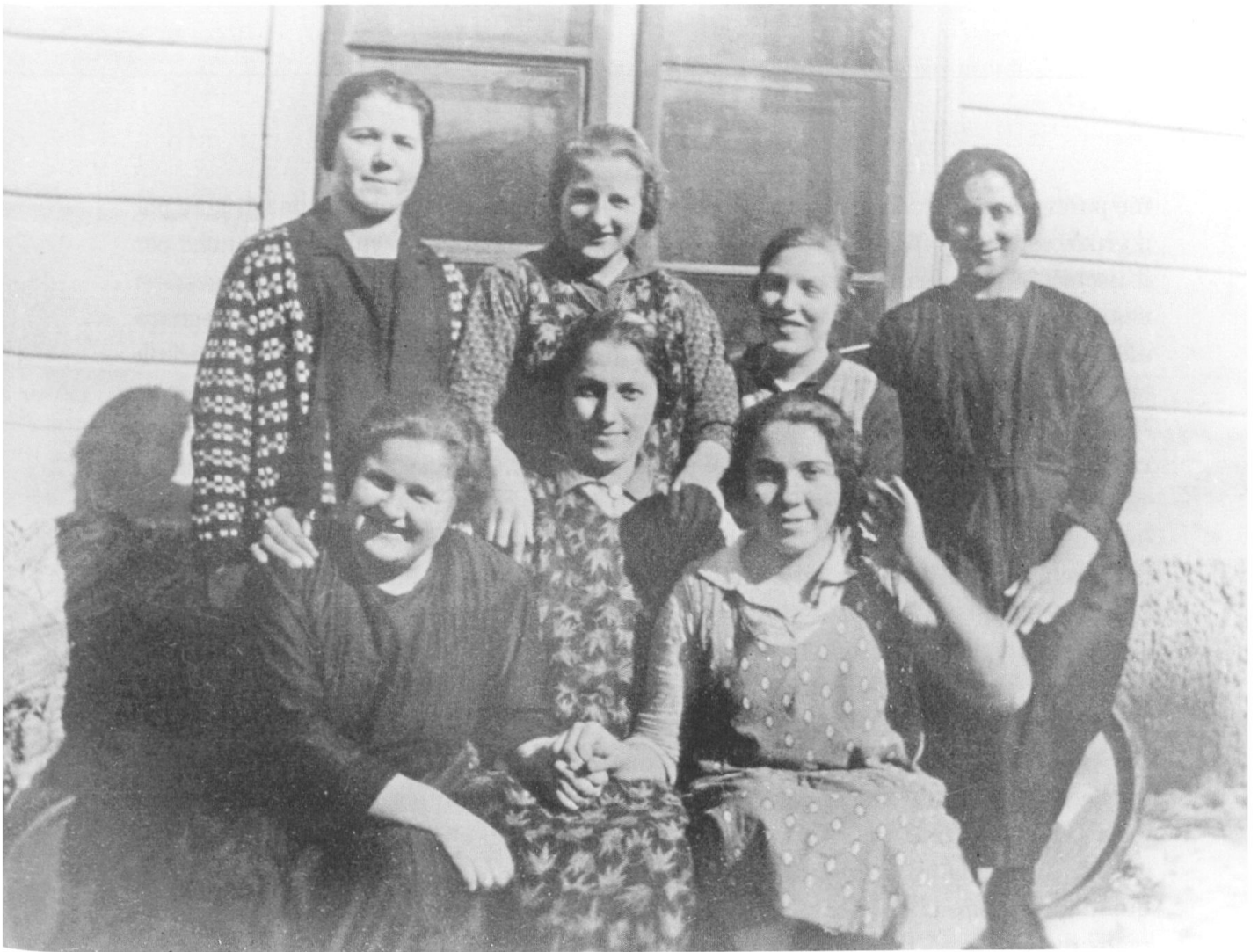
Donne valtelinesi d'emigrazione d'anteguerra a Pontresina