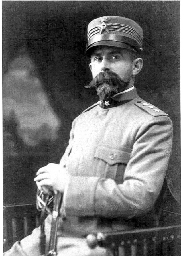
Il Capitano Medico Ugo Frizzoni nel 1916

Quando l'Italia entrò in guerra Ugo Frizzoni continuò ad impegnarsi nell'attività politica, fino a quando venne chiuso anche l'ultimo canale percorribile. Subito dopo, cercò una strada alternativa che fosse coerente con i suoi principi religiosi e la sua fede politica. La scelta di partire per il fronte come medico volontario nella Croce Rossa Italiana deve essere intesa prima di tutto in questo senso, come espressione del desiderio di continuare ad essere solidale con la classe lavoratrice. Frizzoni mise a disposizione le proprie risorse e le proprie competenze per curare e per guarire quei figli del proletariato a cui aveva già dedicato la propria vita, attraverso la sua scelta professionale. Sicché, il 1° aprile del 1916, iniziò a prestare servizio «con esplicita rinuncia allo stipendio» presso l'Ospedale Territoriale della CRI bergamasca. 12 Pochi mesi più tardi, il 31 agosto, era ufficialmente arruolato dal Comitato bergamasco della Croce Rossa, con il grado di Capitano Medico.