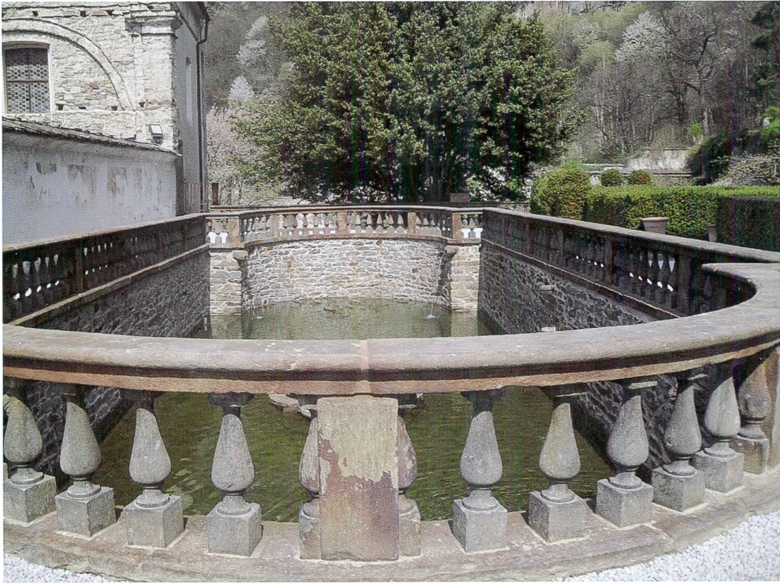
Particolare della peschiera, dove recentemente è tornata l'acqua. (Foto 7)