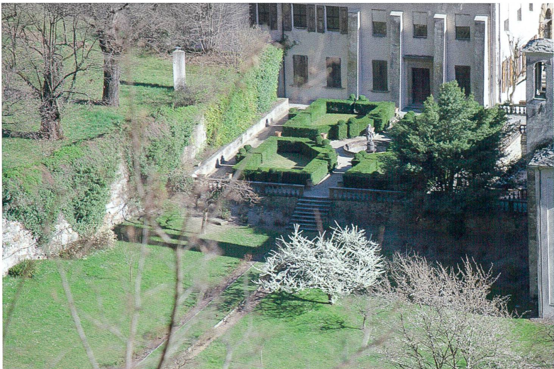
Palazzo Vertemate Franchi, il giardino all'italiana dal frutteto. (Foto 6)

Ma qui interessa soprattutto l'attigua peschiera, protetta da una fitta sequenza di balaustrine in pietra ollare (foto 7). È di forma rettangolare terminante sui due lati minori con un semicerchio, disegno che è ripreso, più in piccolo, dall'elemento centrale sul fondo. Nel 2014 è tornata l'acqua, dopo un lungo periodo di assenza. A conferma