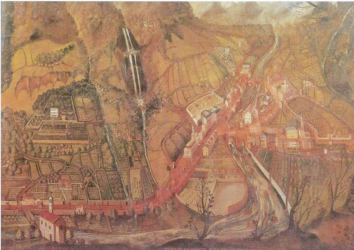
Palazzo Vertemate Franchi, Piuro prima della frana del 1618, ricostruito qualche decennio dopo in un dipinto a olio su tela. (Foto 1)

Anche lo storico grigione Johann Guler von Weineck, pubblicando il suo Raetia a Zurigo nel 1616, cita, tra le famiglie piurasche, solo i Vertemate e tra essi i fratelli che fecero costruire il palazzo, cioè “Guglielmo e Luigi, che ricoprono le cariche più im-