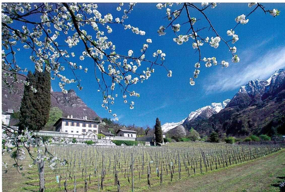
Palazzo Vertemate Franchi, il vigneto oggi. (Foto 4)

A convincere del fatto che non si trattava di una villa di piacere, ma di un'abitazione permanente restano i terreni agricoli. Innanzi tutto – cominciando da quello a quota più bassa, verso Chiavenna per intenderci – si incontra il grande vigneto rettangolare che si estende per la massima lunghezza da nord a sud. E certo il vino