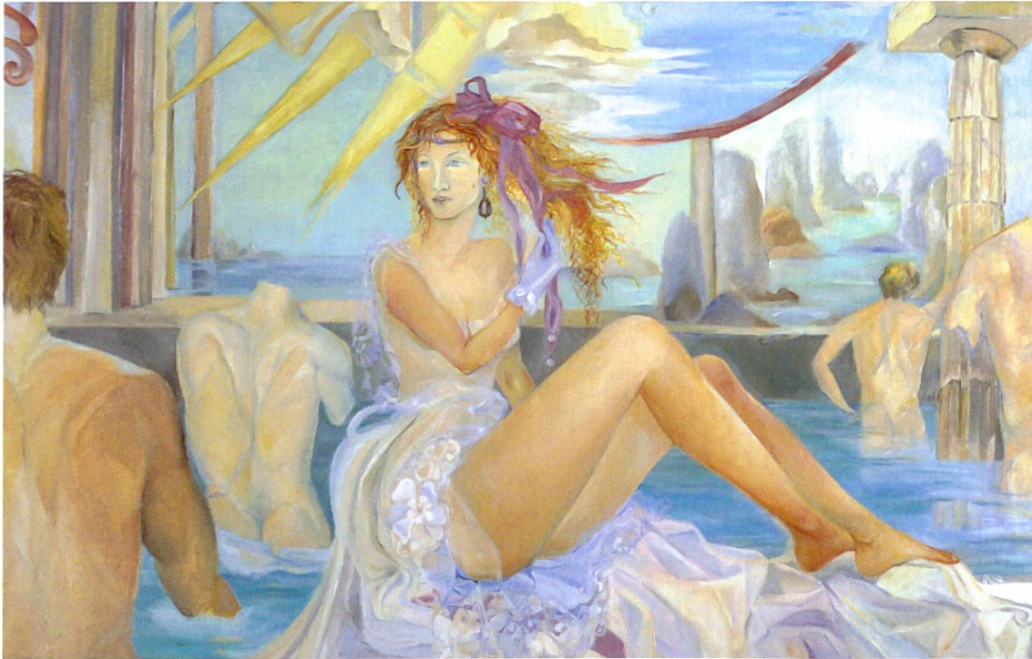
Anna Galanga, Al fiume , olio su tela, 120 x 133 cm

estati calde e afose, dalle risate cristalline dei miei sei fratellini. Adolescente, mi sono trasferita con la famiglia nella casa materna di Viale Garibaldi a Tirano (So), dove, con maggior consapevolezza, mi sono lasciata trasportare nel mondo dell'arte dall'esempio del nonno materno, stimato decoratore di finissimi fregi, grottesche, cartigli, trompe-l'oeil ed emblematiche meridiane.