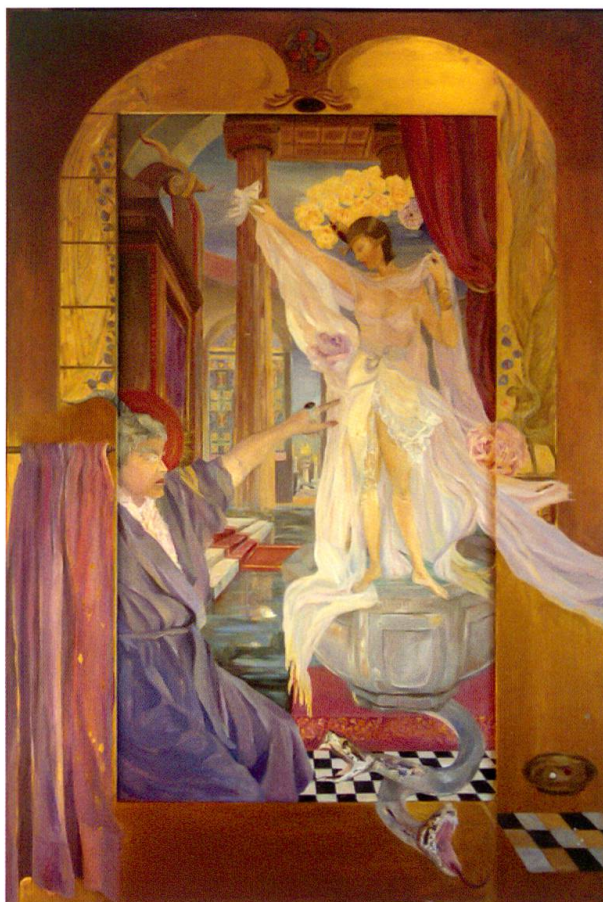
Anna Galanga, Noli me tangere , olio su tela e pioppo, 117 x 172 cm

Oltre la siepe di bosso, nel giardino dei trifogli e del tarassaco, dove il vento tesse le sue carezzevoli reti, salmodiando un breviario di canti e preghiere sommesse, veglia ancora un’esile fanciulla inguainata di trine, mentre ampie falde le coprono il volto pudico. Silente ed assorta, volge gli occhi alle stelle, poi sottocchi s’insinua tra le pieghe di una luna evanescente, colta da cupa vertigine che trasmuta il suo corpo di luce, mentre intinge la mano nel rosso carminio per pingersi l’umido labbro. Sulla tela: lei stessa, l’imago dell’alba nascente.