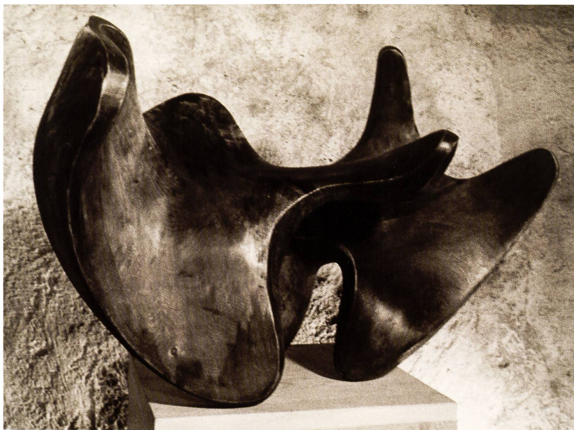
Garuda, 1976-1977, cembro, 48 x 74 x 40 cm

Tra il 1965 ed il 1975 si collocano principalmente le sculture che s'ispirano direttamente alle forme naturali delle radici e dei ceppi, all'inizio con qualche ammiccamento al figurativo, che però presto cede ad un astrattismo organico. Il Trovatello del 1970 ne è un bell'esempio: non presenta una veduta preferenziale, non ha neppure un sopra e un sotto; sembra argento vivo che ha la facoltà di mutare il proprio volume materiale in mille forme. Si potrebbe pensare che questa scultura funzionerebbe altrettanto bene se fosse realizzata con un altro materiale, ma ci si rende subito conto che la relativa morbidezza (rispetto alla pietra o al metallo) e la variegata colorazione del legno sono parte integrante della qualità ricca di molteplici aspetti. In Trovatello prevalgono le rotondità e il corpo è flessuoso e privo di spigoli; in Omphalos – del 1973 – le linee iniziano invece ad essere importanti, modulandone la forma. Questa scultura che l'artista fece fondere in bronzo precede le opere prodotte dopo il 1975 per l'accurato equilibrio formale. Come tante altre sculture di quel periodo, Tritoni , del 1972/75, gioca sull'equilibrio tra forme tondeggianti e forme spigolose. Le sculture della prima fase lavorativa hanno tutte in comune l'appartenenza ad un mondo espressivo primordiale ed anarchico. Sono sculture dinamiche e forti, capaci di far vibrare lo spazio intorno ad esse.