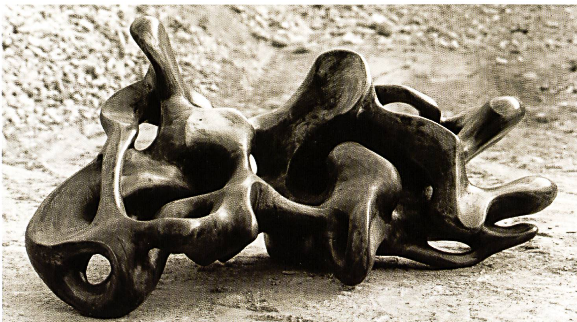
Tritoni, 1972/75, cembro, 78 x 165 x 90 cm

Bott parte da forme di legno che inizialmente intaglia appena, ma soprattutto leviga accentuando i vuoti e i pieni, le parti concave e quelle convesse (1965-1975). In una seconda fase le sue sculture dimostrano un'impostazione più classica, più scolpita, in cui le forme naturali del ceppo retrocedono dietro la volontà artistica (1976-1990). Il discorso artistico che continua a sviluppare in una terza fase, lo porta a realizzare sculture più architettoniche, concepite senza più riferimento alla forma del materiale