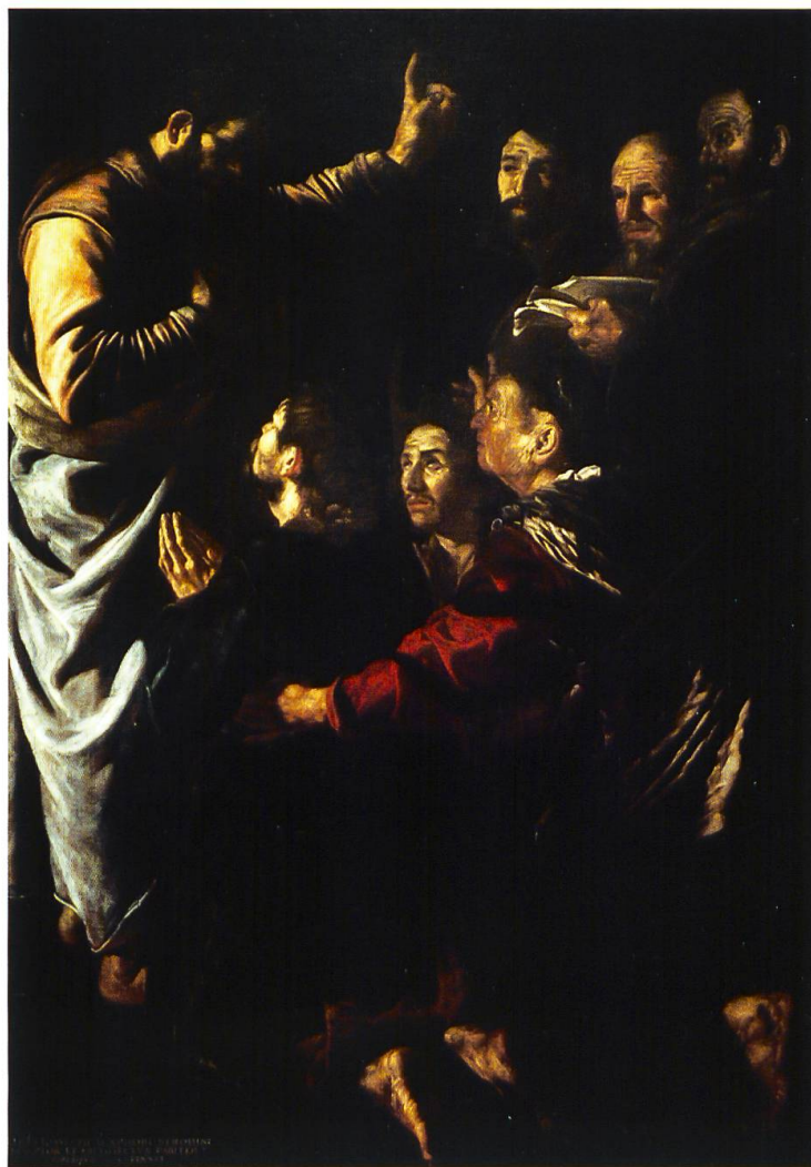
Giovanni Serodine, Chiamata dei figli di Zebedeo , 1625 ca., olio su tela. Chiesa dei SS. Pietro e Paolo – Ascona

È certamente il nero – «questo nobile colore cui già Platone ebbe ad attribuire il significato della conoscenza e della dimenticanza» – il timbro cromatico antiborghese e tragico che sembra caratterizzare il sodalizio umano e intellettuale tra lo scrittore novatese Giovanni Testori e il pittore zurighese-bregagliotto Varlin. Ed è quello stesso nero in cui annega il villaggio di Bondo nei mesi invernali o che trasuda dalle tele di Caravaggio, Giovanni Serodine e Tanzio da Varallo; ed è poi anche il colore della peste che fece strage di uomini ai tempi di san Carlo. Non a caso «i Maestri che Varlin predilige sono il Goya nero (la sua caverna, cioè, di mostri) e il nero, funebre finale di Franz Hals»: 1 la triade, diciamo, “borromaica”, che sotto il segno del realismo in pittura raggruppa peccato, carnalità e, per l'appunto, tenebra, caratterizza anche il destino di Testori sin dai tempi dell'apprendistato presso Roberto Longhi. Al grande storico dell'arte e sottilissimo prosatore Giovanni Testori dedica, significativamente, il memorabile saggio su Martino Spanzotti (1954), che getta gli auspici per una brillante carriera di critico d'arte e di articolista per il «Corriere della Sera», senza tuttavia aderire in maniera acritica alle istanze longhiane, poiché giustamente «i maestri sono fatti per essere mangiati in salsa piccante», come ammoniva un suo altro celebre allievo, Pier Paolo Pasolini.