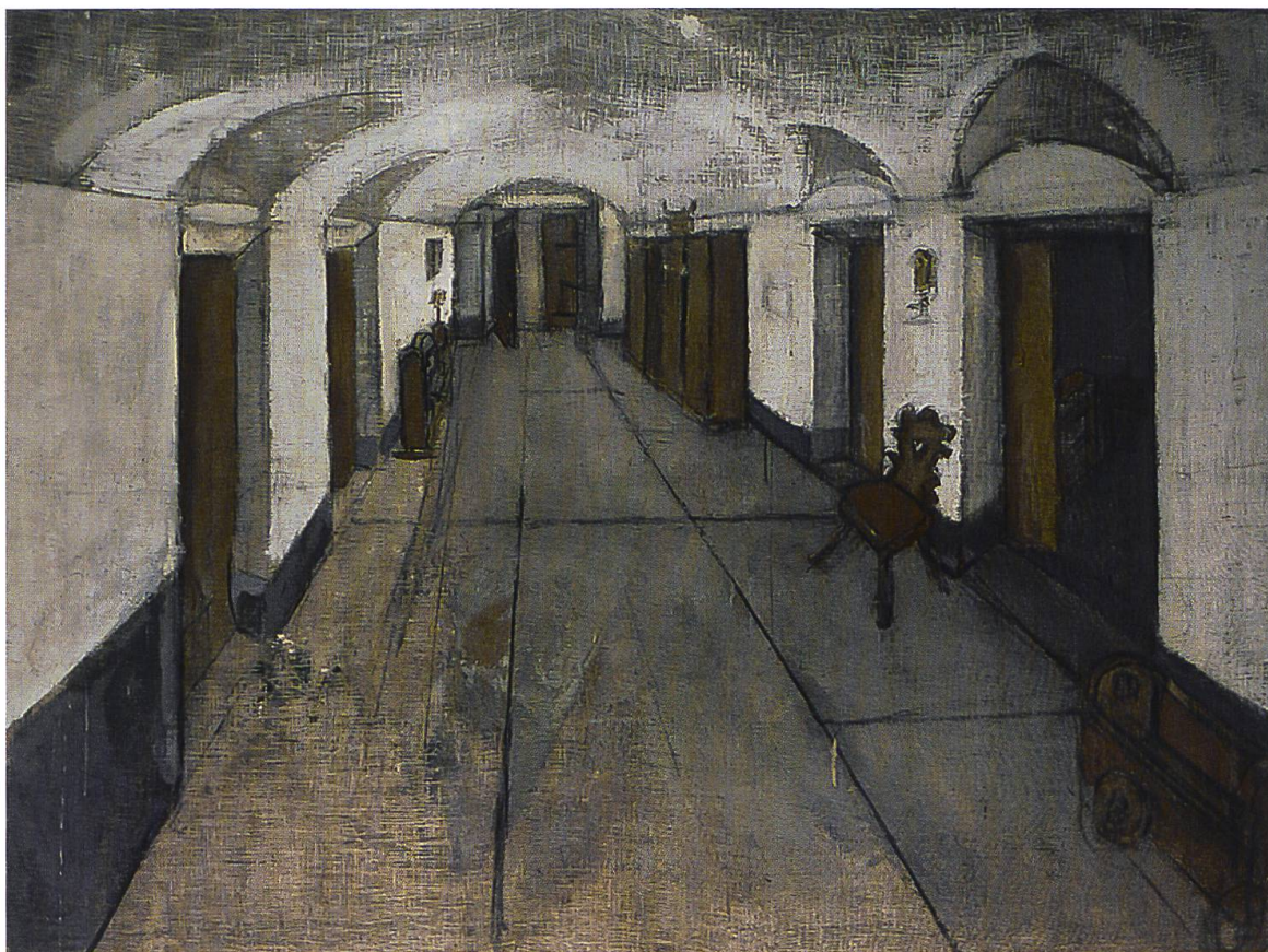
Varlin, Corridoio di Bondo , 1964, olio e carboncino su tela. Collezione privata

Se si condivide l'ipotesi di Merlau-Ponty secondo cui «l'irraggiarsi del visibile» possiede la singolare capacità d'inglobare e fondere visione e vedente, interno ed esterno, 12 allora anche gli interni dipinti da Varlin potrebbero essere classificati come "paesaggi", perlomeno in virtù del fatto che le temperie esterne possano in qualche modo insinuarsi in un ambiente chiuso. Quanto, infatti, apparirebbe più muta e fredda la stanza immaginata da Piero della Francesca senza quel riflesso di luce dorata dell'Adriatico che, di soppiatto, penetra attraverso i vetri piombati alla spalle della Madonna di Senigallia? E come immaginare la Camera di Vincent ad Arles (1888), se non circondata dai campi di grano, dai cipressi e dalle distese di lavanda della Provenza? Allo stesso modo, il cupo interno del Corridoio a Bondo (1964) non ha