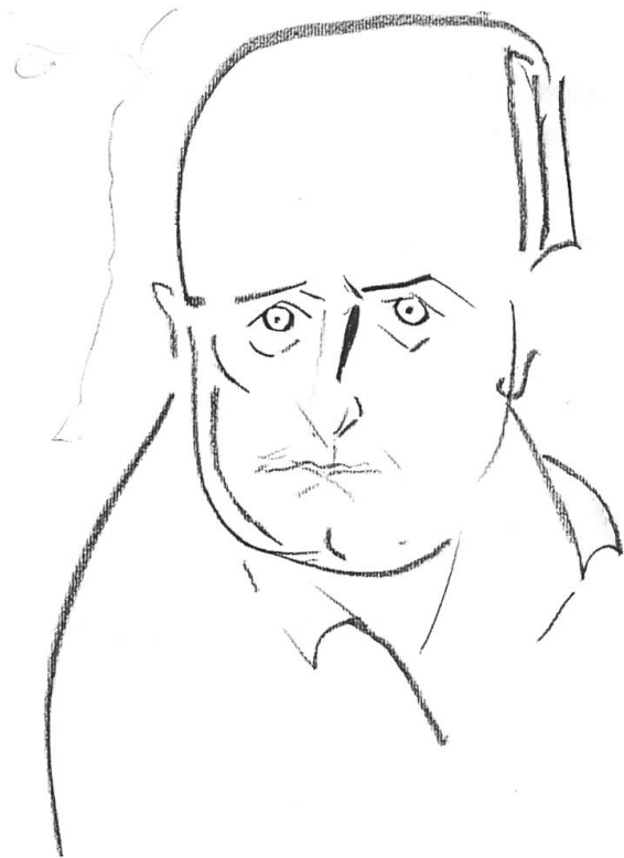
Varlin, Giovanni Testori, 1972 ca., carboncini su carta. Collezione privata