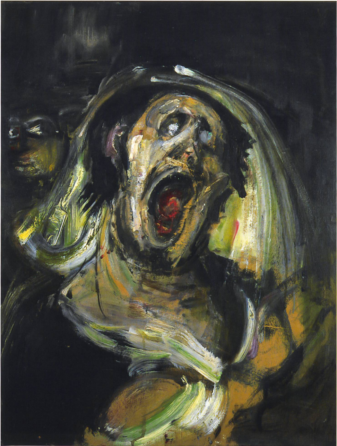
Varlin, D'après Goya, 1970, olio e carboncino su cartone. Collezione privata

Forte di una solida esperienza di critico d'arte contemporanea, maturata negli anni Quaranta, e grande conoscitore dell'arte lombarda, Testori ha certamente il merito di aver modificato una volta per tutte il nefasto sbilanciamento (purtroppo ancora presente nella vulgata comune nonché inculcato nelle scuole) a totale favore della grande arte rinascimentale toscano-romana e veneziana e a parziale discapito della