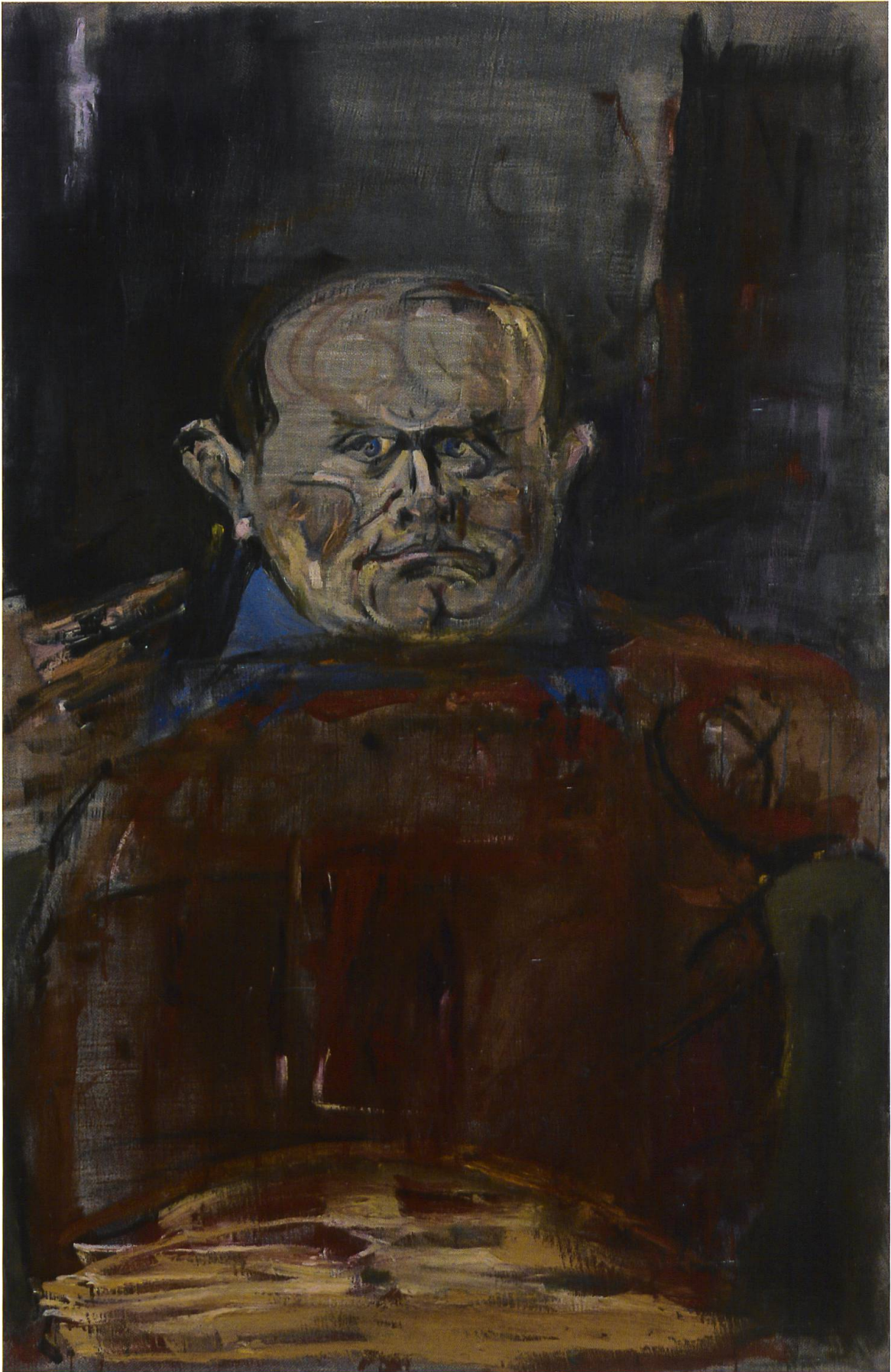
Varlin, Giovanni Testori col maglione rosso, 1970, olio su juta. Collezione privata