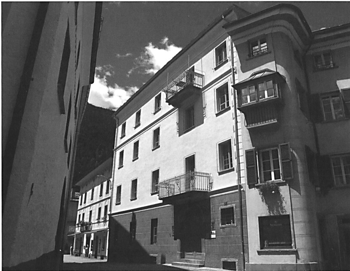
Casa Battaglia, ubicata in via San Giovanni e oggi riammodernata, prima sede del laboratorio della Tessitura