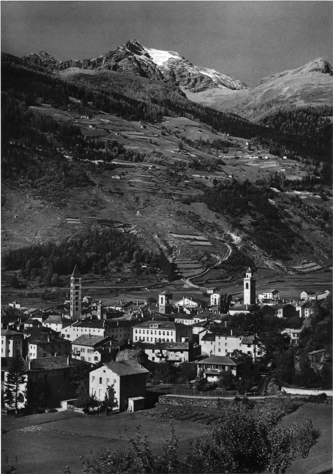
Vista su Poschiavo, con il Borgo, i maggenghi sul versante destro della valle, il Piz Varuna a sinistra e il Curnasel a destra.