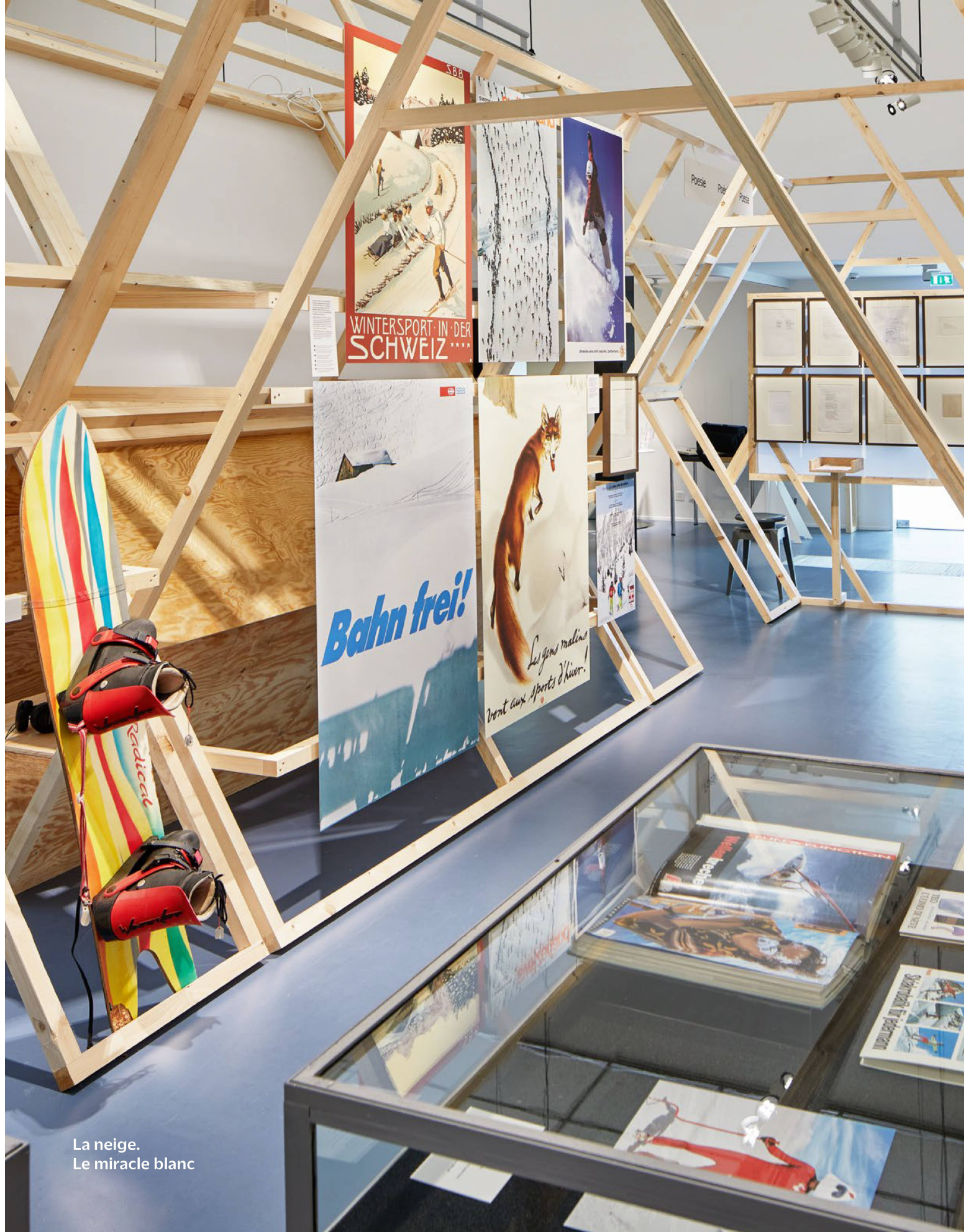
La neige. Le miracle blanc