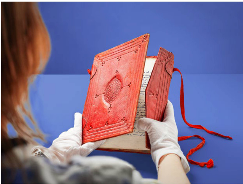
Isabelle Eberhardt Portefeuille venant de la collection Isabelle Eberhardt

différentes versions de ses romans, un dossier de presse, des lettres du public, des distinctions ainsi que quelques dessins et collages. Les archives littéraires de l'écrivain du Vallemaggia (TI) Plinio Martini (1923–1979) sont venues enrichir le fonds de langue italienne, alors que la collection de documents et de manuscrits de l'écrivaine et voyageuse francophone Isabelle Eberhardt (1877–1904) constitue une découverte dont l'importance doit encore être établie.