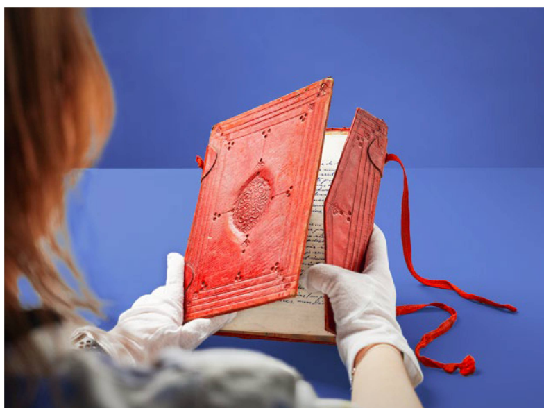
Isabelle Eberhardt Portefeuille venant de la collection Isabelle Eberhardt

différentes versions de ses romans, un dossier de presse, des lettres du public, des distinctions ainsi que quelques dessins et collages. Les archives littéraires de l'écrivain du Vallemaggia (TI) Plinio Martini (1923–1979) sont venues enrichir le fonds de langue italienne, alors que la collection de documents et de manuscrits de l'écrivaine et voyageuse francophone Isabelle Eberhardt (1877–1904) constitue une découverte dont l'importance doit encore être établie.