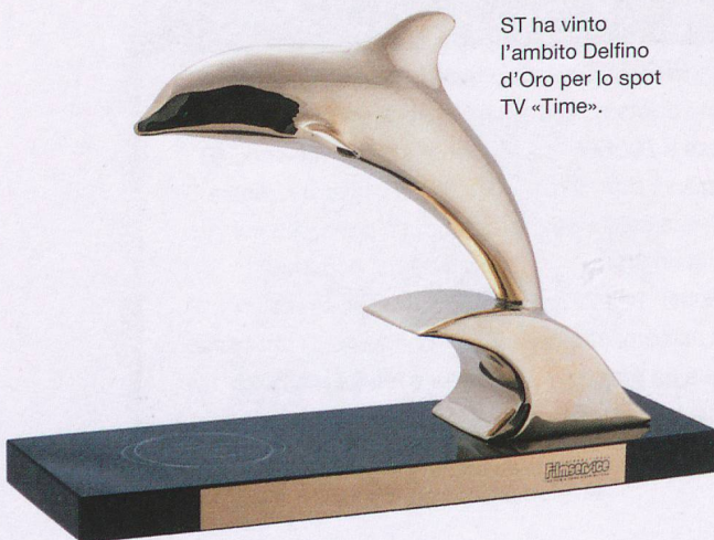
ST ha vinto l'ambito Delfino d'Oro per lo spot TV «Time».