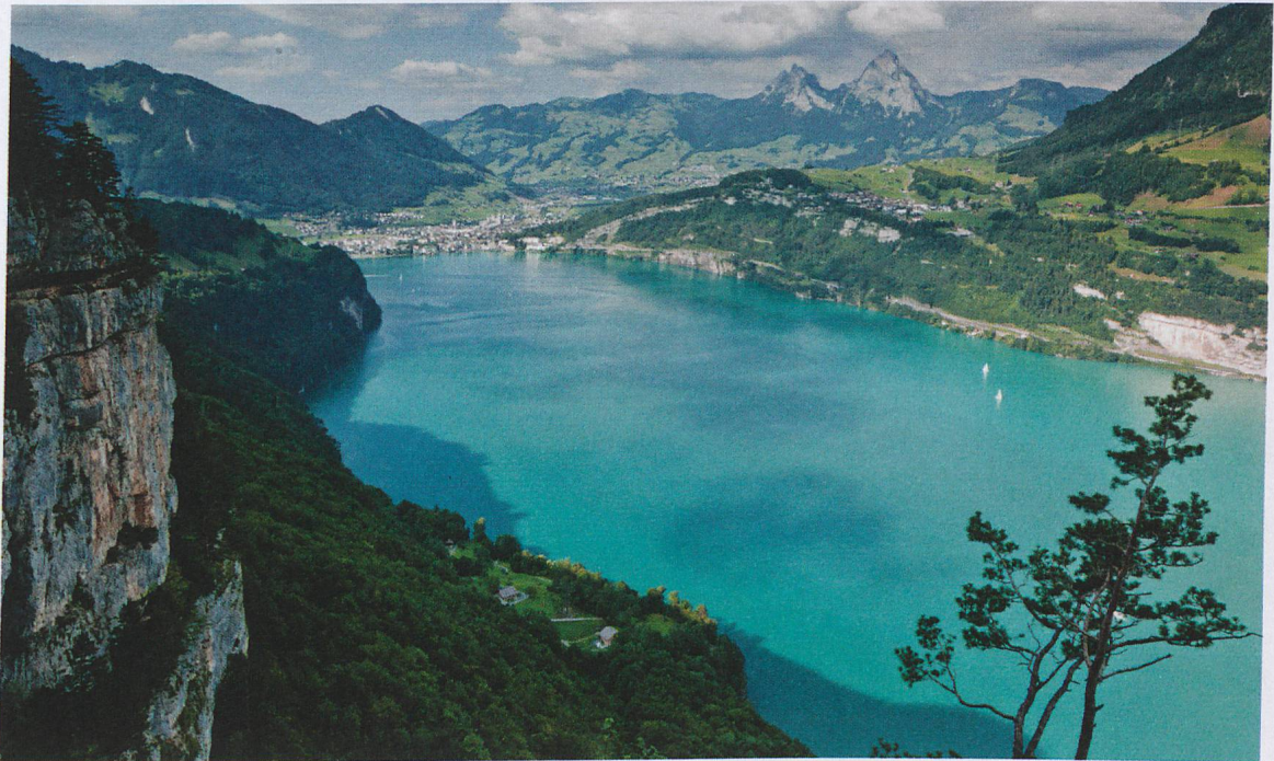
Lungo il Grand Tour of Switzerland: grandioso panorama del lago di Lucerna, con Brunnen e le Mythen sullo sfondo.

La nuova realtà di mercato – opportunità intatte e un asso nella manica.