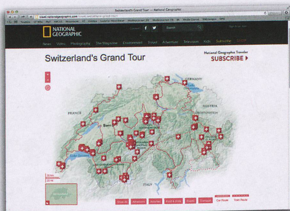
50 attrattive del Grand Tour of Switzerland su cui cliccare per un viaggio virtuale: il sito web «National Geographic».