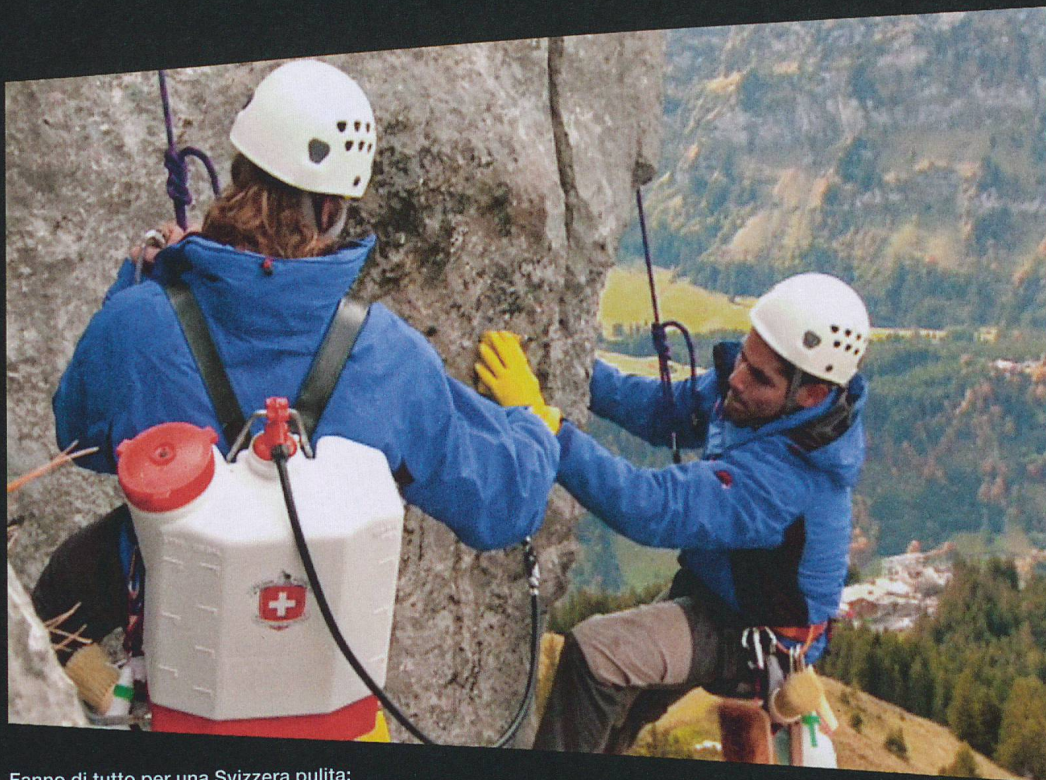
Fanno di tutto per una Svizzera pulita: i pulitori di rocce del 1 aprile 2009.