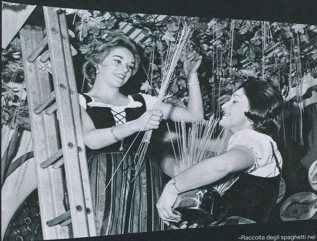
«Raccolta degli spaghetti nel Canton Ticino» (1957), girato dalla BBC con il contributo dell'ufficio UNST di Londra.