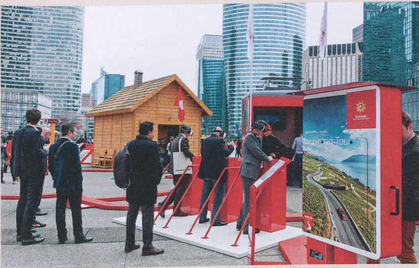
Il percorso interattivo nella Svizzera del turismo itinerante è stato molto coinvolgente.