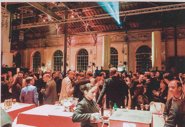
Nel Bâtiment des Forces Motrices (BFM) di Ginevra ha avuto luogo un evento serale della Fédération Internationale des Déménageurs Internationaux (FIDI).

Per poter compensare tale congiuntura sfavorevole, lo Switzerland Convention & Incentive Bureau (SCIB) ha continuato a dare impulso alla diversificazione dei mercati e dell'offerta. Un grande potenziale risiede ad esempio nei comparti Incentive (soprattutto in Asia) e dei congressi associativi, meno sensibili ai costi, dove la Svizzera può mettere a profitto la propria ottima immagine. Nel 2016 lo SCIB ha tra l'altro portato in Svizzera l'Associazione per la Fisioterapia con 5000 partecipanti e la conferenza della Fédération Internationale des Déménageurs Internationaux (FIDI) con 600 partecipanti. Assieme ad altri meeting e a numerosi viaggi incentive, il bilancio 2016 è di 1479 offerte evase e di 797 meeting organizzati in Svizzera.