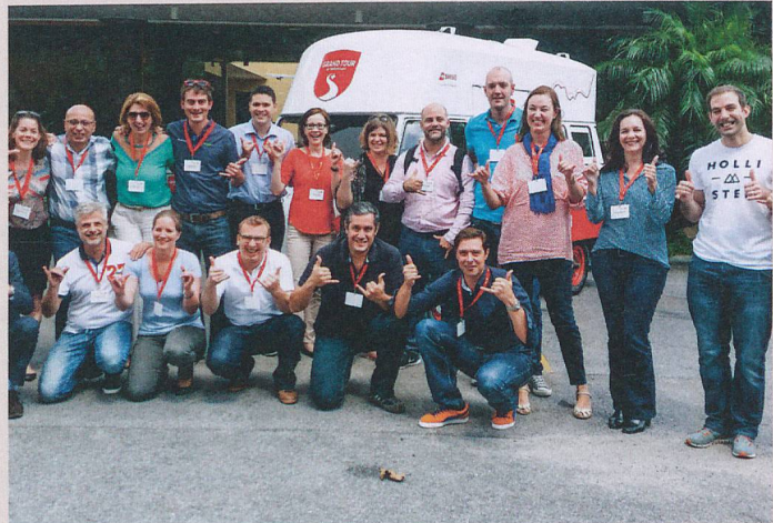
La STE Brasile di nuova concezione è stata accolta molto bene dai partner turistici.