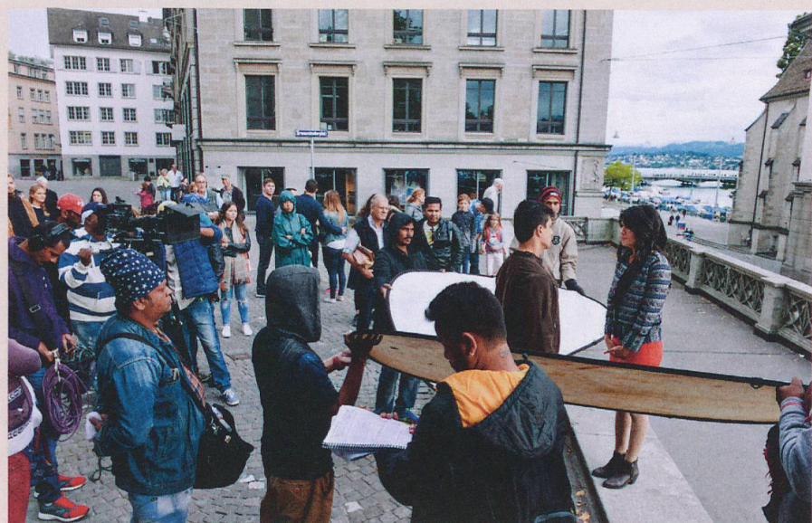
ST ha assistito la troupe indiana di 34 persone con 1000 kg di attrezzatura nel suo viaggio attraverso la Svizzera, come qui a Zurigo.