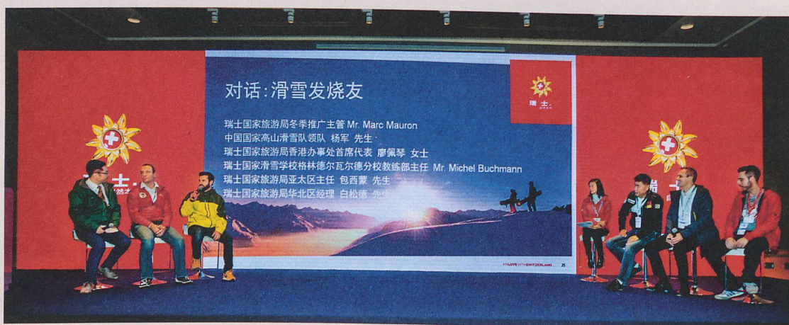
ST presenta la Svizzera invernale al primo World Winter Sports Expo a Pechino.

*Fonte: «China Ski Industry White Book 2015/2015 International Report on Snow & Mountain Tourism», Laurent Vanat.