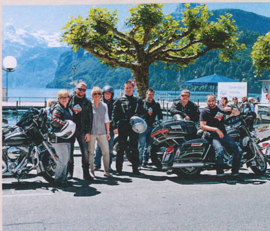
Giornalisti polacchi scoprono il Grand Tour of Switzerland in sella a moto Harley-Davidson, con sosta a Brunnen SZ.

*Articoli positivi con posizionamenti, immagini e contenuti turistici di rilievo pubblicati su un Key Medium