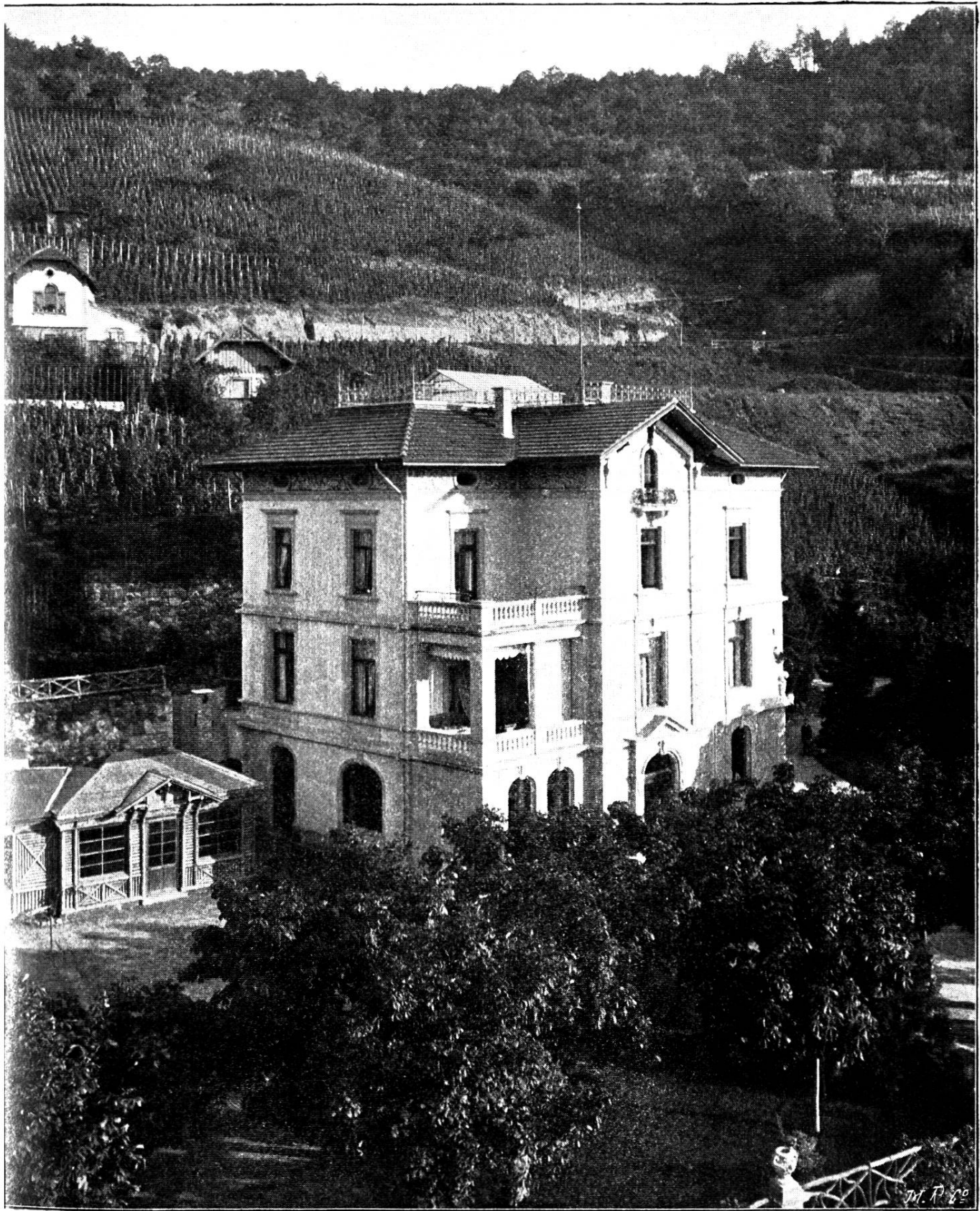
Négatif de M. Röbeke, Fribourg c/B.

Similigravure : Meisenbach, Riffarth & Co, Munich.