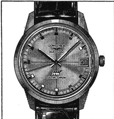
L'Ultra-Chron Longines, dont le cœur bat deux fois plus vite que celui d'une montre habituelle, est si précise, si régulière que l'horloger-bijoutier vous remettra un certificat qui garantit sa précision.

Autrefois, bien avant les ordinateurs, les astronomes affirmaient que l'étoile de Bethléem — qui est en fait la conjonction très rare des planètes Saturne et Jupiter dans le signe des Poissons — revenait « environ » tous les 850 ans. Nous aimions cette histoire de l'étoile et des Rois mages, mais ce manque de précision nous fâchait un peu et tout