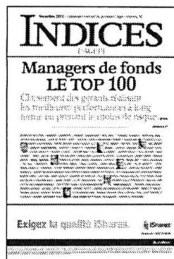
Mensuel Encarté dans L'Agefi