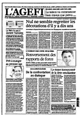
Lu - Ve Kiosque / Abonnement

Retrouvez l'intégralité de nos contenus sur www.agefi.com