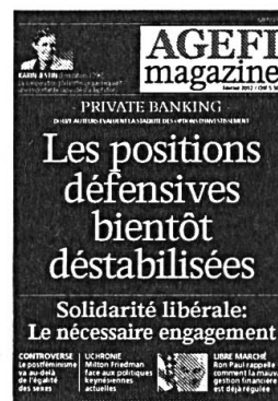
6 parutions Kiosque / Abonnement