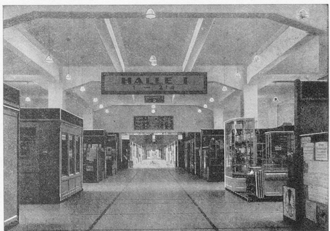
Une autre halle d'exposition

L'offre des industries diverses est ordonnée en vingt et un groupes réguliers et en Foires professionnelles et sections spéciales. Au nombre des groupes qui intéressent plus spécialement l'étranger, mentionnons ceux des produits textiles, de l'industrie électrique, des ustensiles de ménage, de la mécanique en général.