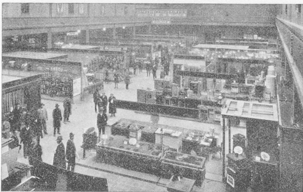
Une halle d'exposition de la Foire

B ALE, la cité rhénane, carrefour des routes européennes, la ville au grand passé, foyer de sciences, d'art et d'intense activité commerciale, convie pour la vingt-deuxième fois ses hôtes, du 26 mars au 5 avril, à la Foire Suisse d'Echantillons.