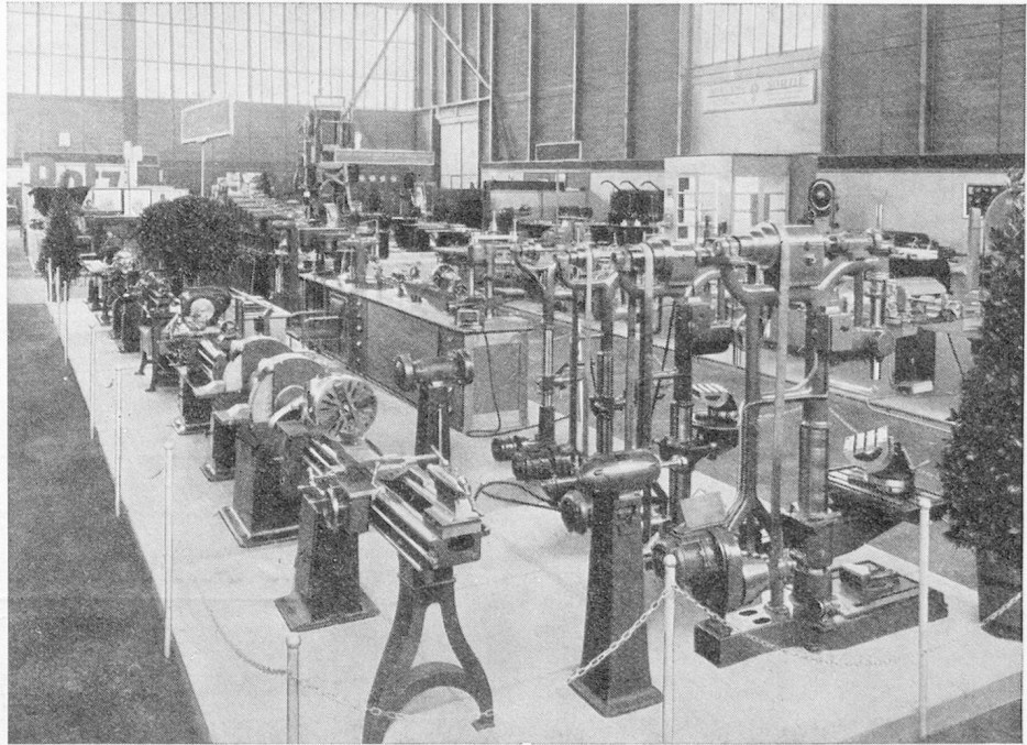
Exposition des machines-outils

Ajoutons enfin, — autre preuve de la considération internationale dont la Foire Suisse d'Echantillons est l'objet, — que dix-huit Etats européens accordent d'importantes réductions de leurs tarifs de transport aux visiteurs de la Foire. Les offices de représentation de la Foire Suisse d'Echantillons