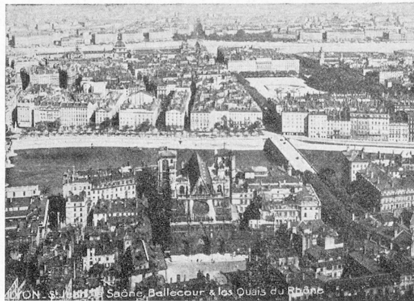
Vue de la ville de Lyon.

Pour 1938, les dates seront donc du samedi 12 au mardi 22 mars.