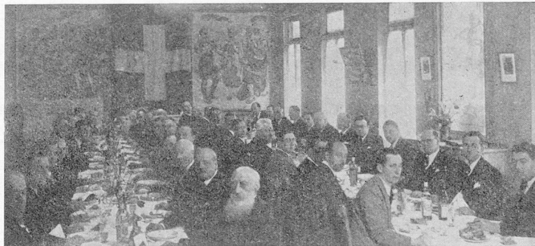
Déjeuner mensuel du 4 avril 1939 de la Section de Marseille

Président de la Section de Marseille de la Chambre de Commerce Suisse en France.