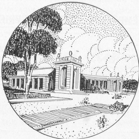
Le Palais Colonial

Le succès de ces diverses manifestations, de même