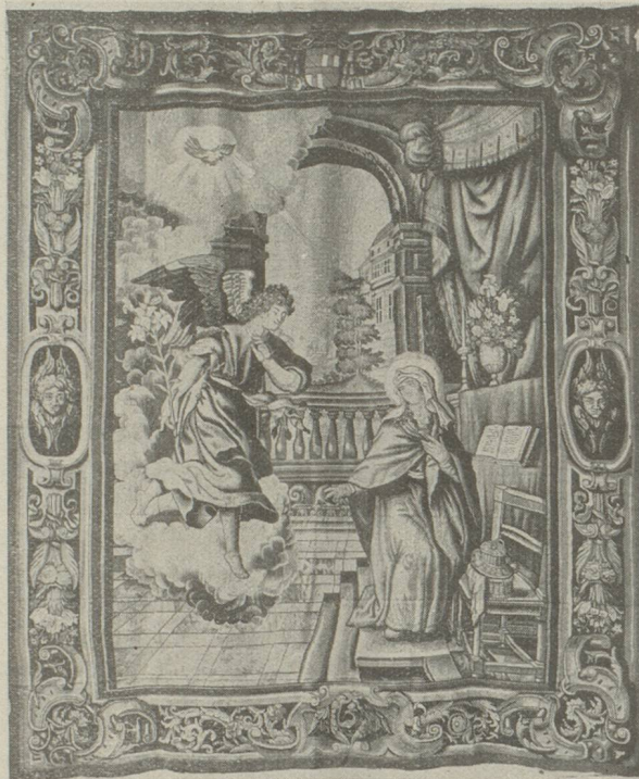
L'annonciation. Tapisserie flamande. Eglise Saint-Just, xvii e siècle

Les particularités techniques n'expliquent pas à elles seules les bonnes ou mauvaises époques d'un