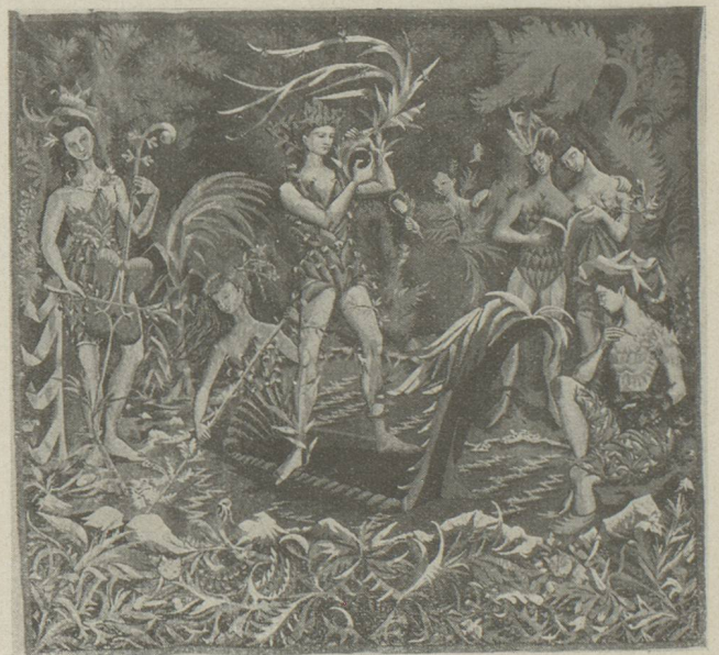
Orphée et les Muses. Tapisserie d'Aubusson de Coutaud. (Edition de la Compagnie des Arts français.)