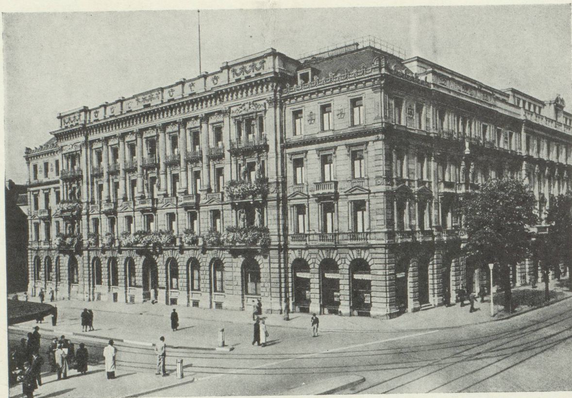
Hôtel de la Banque à Zurich