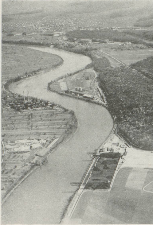
BIRSFELDEN ET AU (BALE-CAMPAGNE)

Durant la deuxième guerre mondiale, la navigation rhénane fut interrompue deux fois pendant une longue période : (de septembre 1939 jusqu'en avril 1941 et d'août 1944 jusqu'en mai 1946). La reprise du trafic fut très difficile en raison des grandes destructions de ponts, ports et bateaux. Peu à peu le trafic rhénan reprend son importance d'avant-guerre. On prévoit un transbordement total d'un million et demi à deux millions de tonnes pour 1947, première année d'après-guerre de navigation ininterrompue.