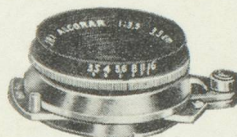
ALCORAR F/3,5, 3 1/2 cm.

Unique appareil au monde qui réunit un système de mise au point par reflex et un télémètre couplé à l'objectif de focale normale.