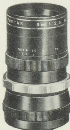
ALPORTAR F/2,5, 9 cm.

Les mises au point et en page par miroir-reflex offrent toutes les possibilités de prises de vues à n'importe quelle distance, sans accessoires spéciaux et coûteux, avec contrôle direct pour tout objectif interchangeable.