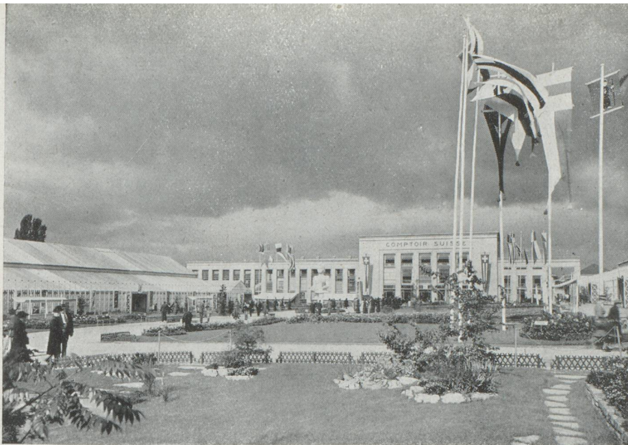
L'entrée du Comptoir suisse, Lausanne