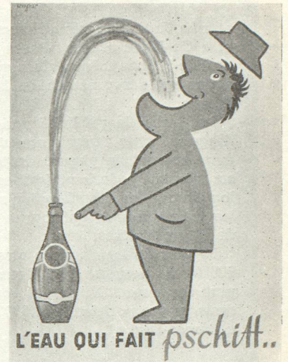
... de Savignac