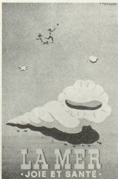
Une affiche touristique de P. Fix-Masseau

Soixante dix-huit pour cent des Français fréquentent le cinéma ; 23 % y vont au moins une fois par semaine, 17 % deux ou trois fois par mois.