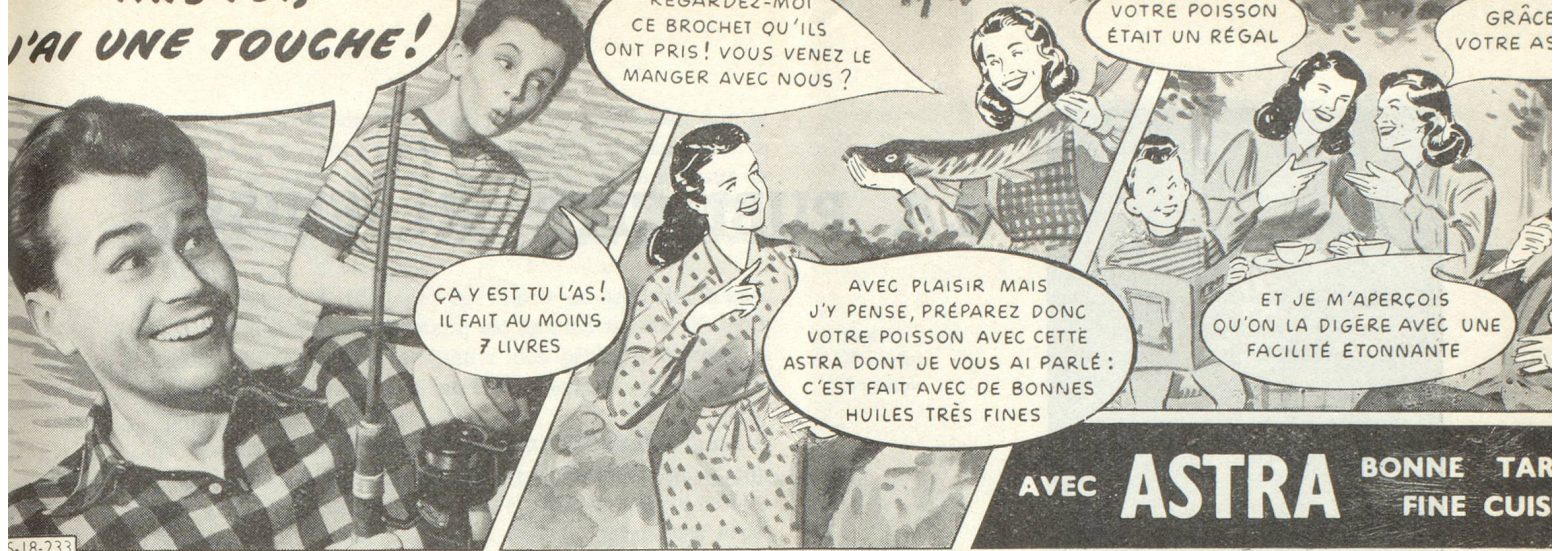
Une formule d'annonce qui a fait ses preuves...

— Etude de la firme ensuite : sa capacité de production (on a vu des campagnes de vente entièrement gâchées parce que les usines ne pouvaient plus « suivre » la demande qui était ainsi provoquée), ses méthodes de vente surtout et les circuits de distribution qu'elle utilise : a-t-on intérêt à ne toucher que les détaillants vendeurs du produit par exemple? Ou, au contraire, à viser l'utilisateur? Ou les deux? Et quels arguments emploiera-t-on pour les uns et pour les autres?