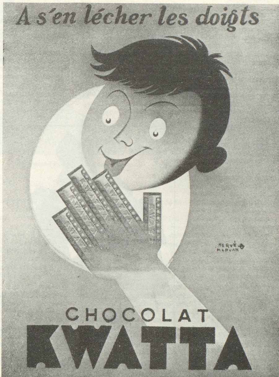
Une affiche humoristique signée Hervé Morvan

C'est dire l'importance que peut avoir ce moyen de publicité dans une campagne d'ensemble. C'est ce qui explique aussi pourquoi les annonceurs français l'utilisent de plus en plus.