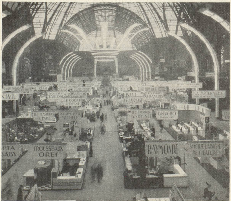
Vue d'ensemble du Salon de l'Enfance 1950.

C'est donc un véritable « Palais des Merveilles » que ce salon, qui illustre bien la place prépondérante que tient en France à l'heure actuelle, l'enfance, la jeunesse et la famille.