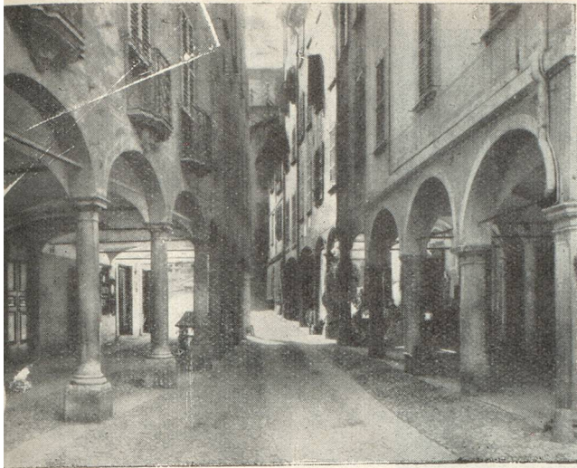
Rue du vieux Lugano